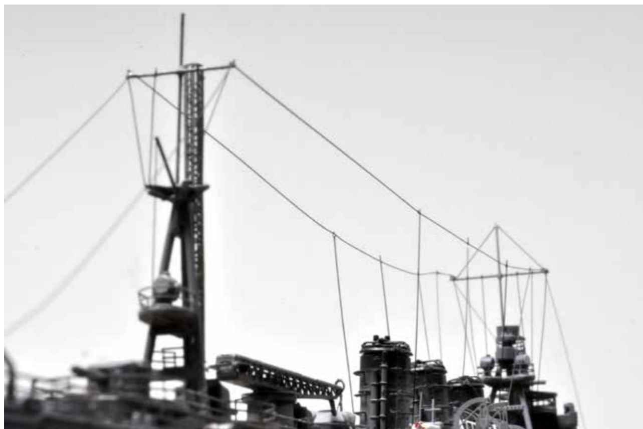
以細膠絲張線。日本帝國海軍輕巡「阿武隈」比例是1:700。