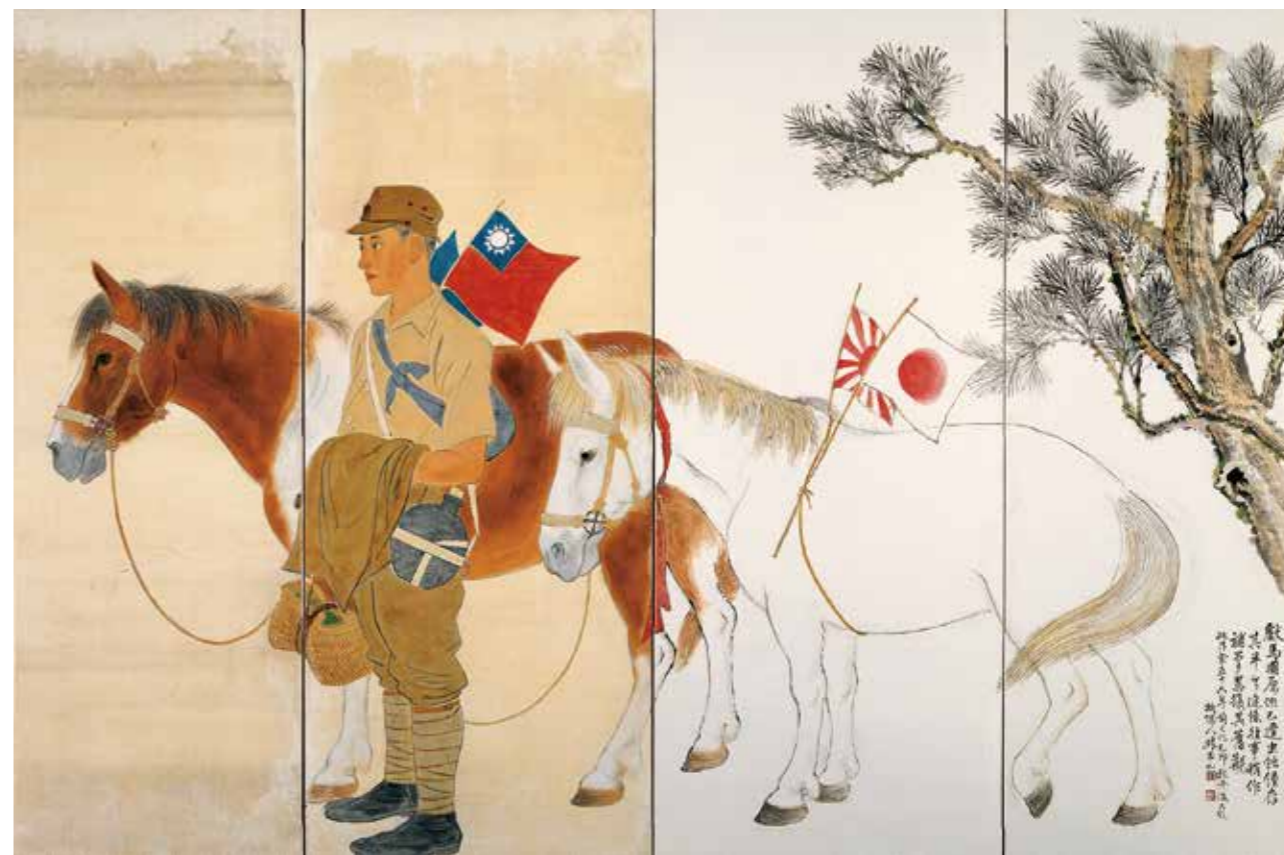
林玉山的《獻馬圖》正說明了台灣身份認同的吊詭（高雄市立美術館典藏）