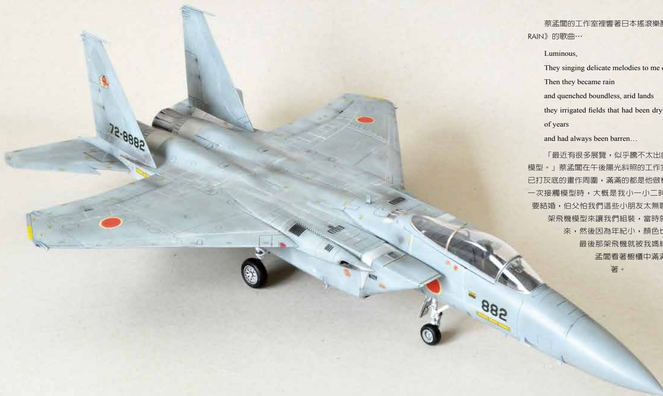
自組的第一架戰機 (F-15J JASDF · 比例: 1/48)