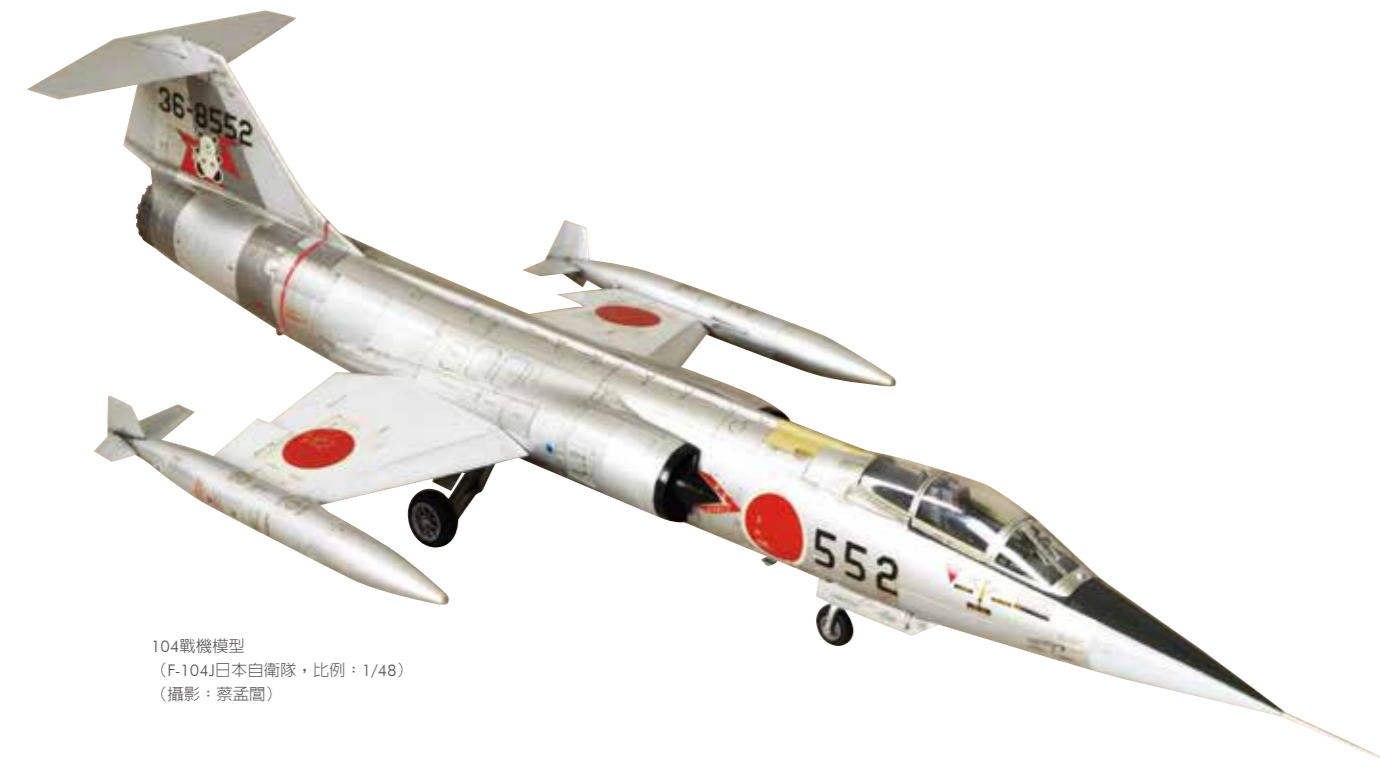
104戰機模型 (F-104J日本自衛隊, 比例: 1/48)