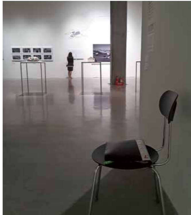
展場門邊的志工座椅常是樂齡觀眾唯一的「依靠」（羅潔尹攝於臺北市立美術館）。

無可諱言，高美館本館在兒美館成立後，確實損失了一批「家庭觀眾」，其中也包括很難得開兒孫的長者，以及陪伴在前二者身邊的成人觀眾。畢竟，兒美館離高美館有段距離，在南台灣的艋陽下缺乏舒適、便捷的交通接駁，要幫兩地觀眾進行串連與參觀加碼並不容易，加上兩館