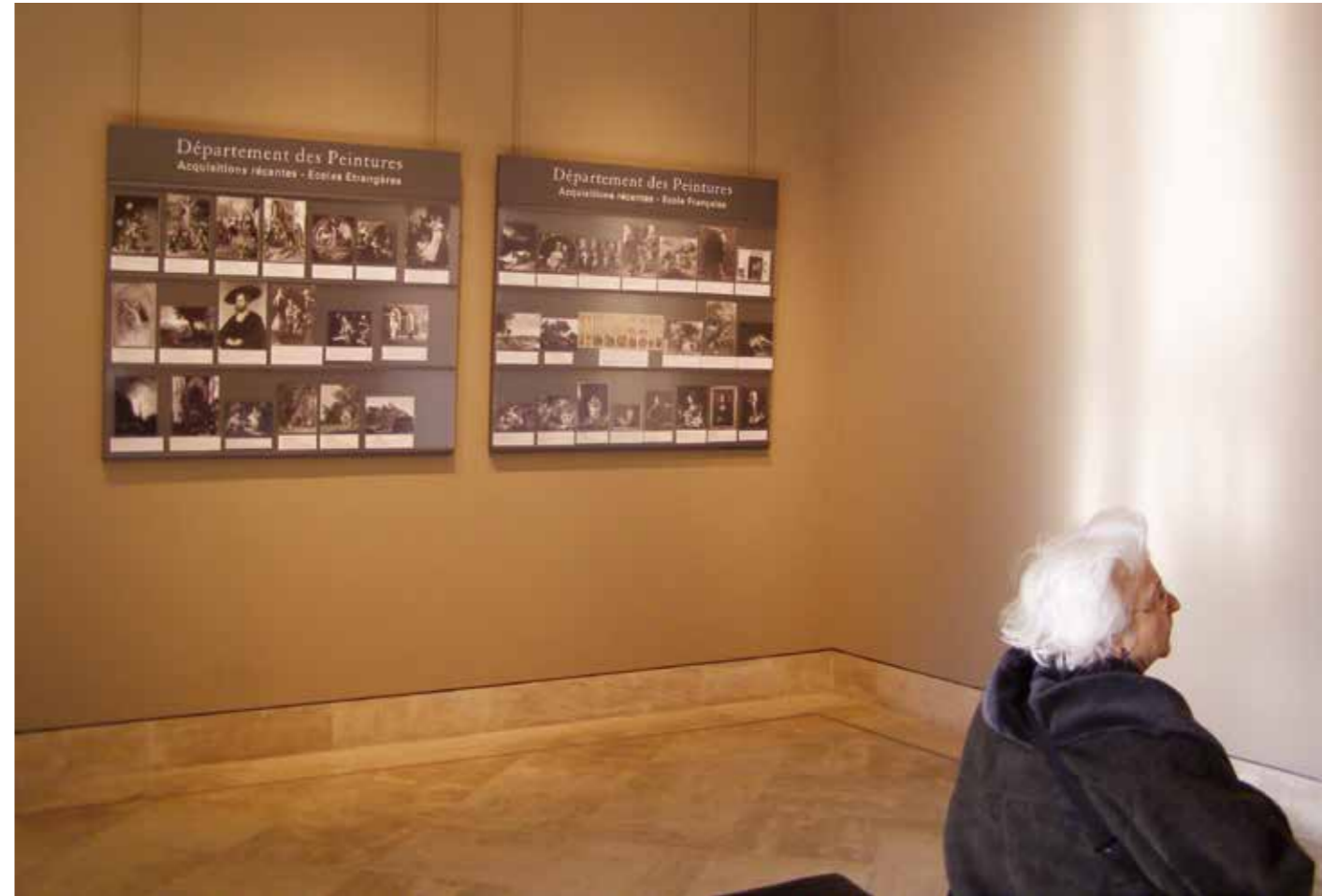
一目瞭然的圖示與貼心的座椅設置，有助於增加高齡參觀者在展間活動的時間與提高參加的意願。

美術館教育主要是以藝術「實物」，向觀眾傳達某些值得推薦的美學觀念，並啟發、誘引觀眾體驗與感受創作自由的價值。已經累積相當人生經驗的長者，多半較為主觀或不易為外界所影響，對「當下」的社會易有理解上的衝突，因此當美術館內出現越來越多讓人無法一目瞭然的「藝術語彙」時，高齡觀眾反而是更需要被帶領去了解當代藝術的一群，尤其高齡觀眾甚難理解，當代藝術最重要的就是「批判」、「反」體制、反種種「理所當然」，挑戰各類極限，未必只是一味地追求傳統美感，這些都可能強烈違反了長者們的認知。