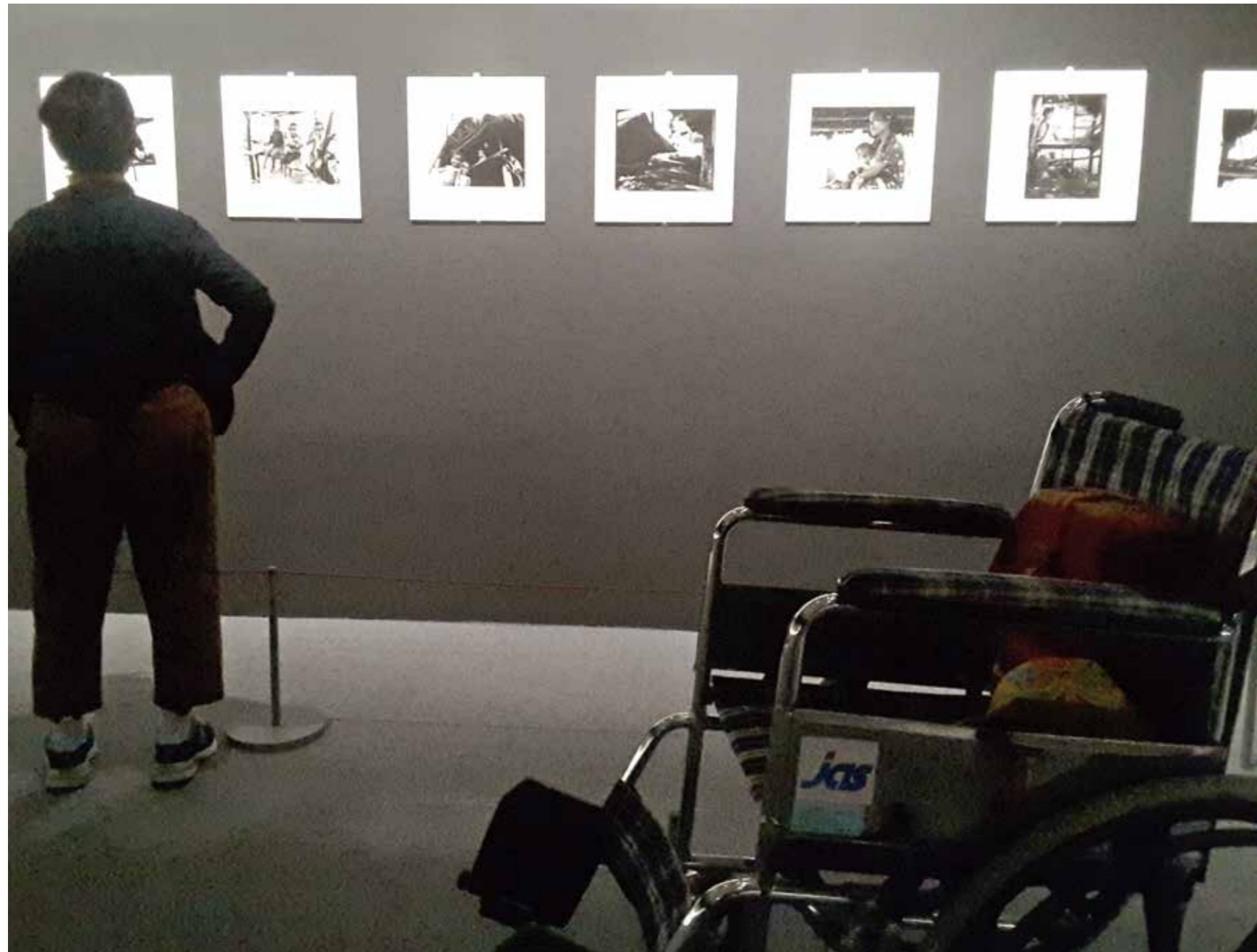
輪椅是許多樂齡觀眾的重要輔具（羅潔尹攝於臺北市立美術館《王信攝影展》）。

兩款針對高齡觀眾的推廣活動，分別為「老祖宗的智慧：撒古流說故事」暨「不沉默的風景：半調子台語導覽場」，後者在「對話」的企圖上便高於前者。