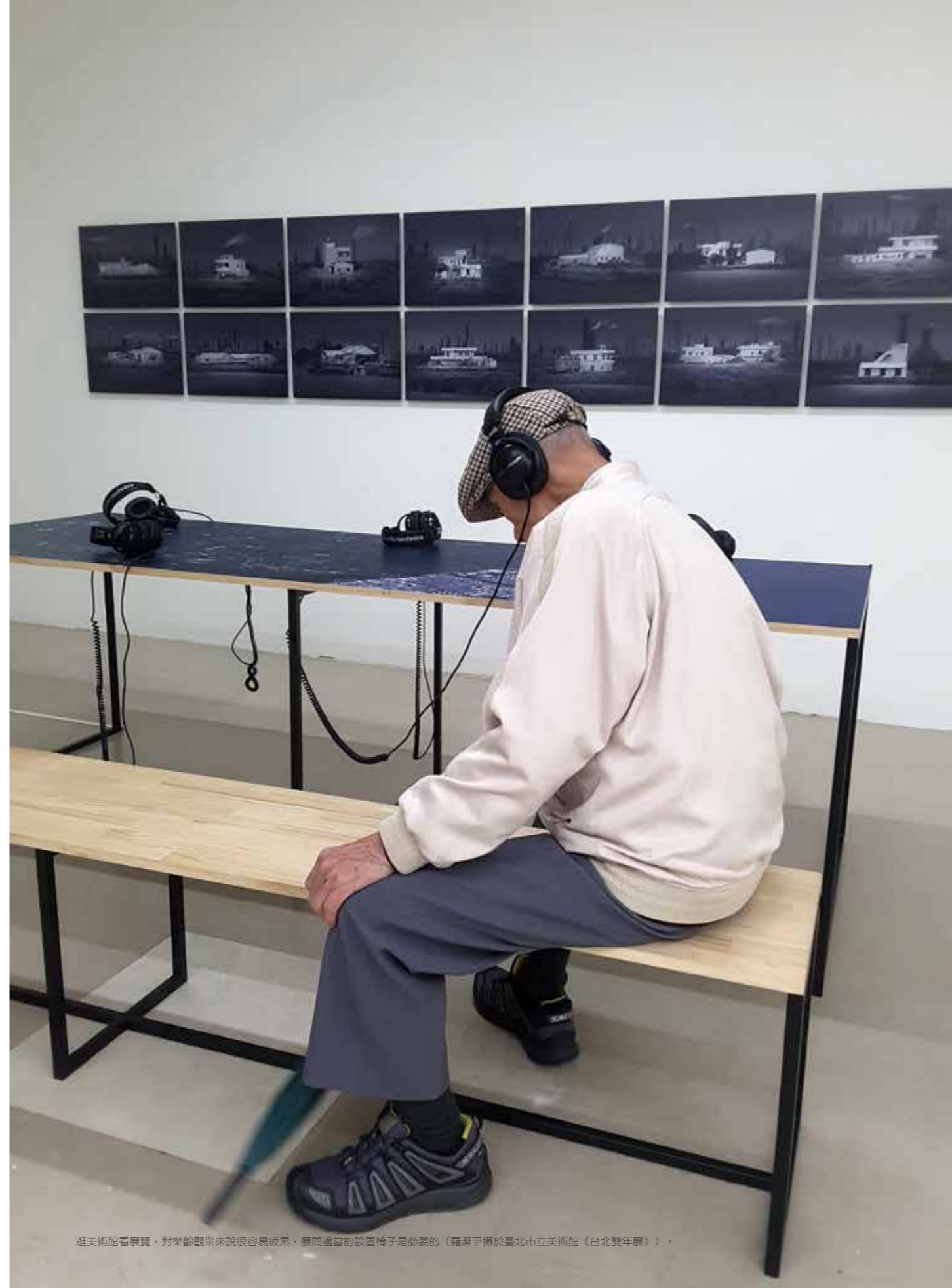
逛美術館看展覽，對樂齡觀眾來說很容易疲累，展間適當的設置椅子是必要的（羅潔尹攝於臺北市立美術館《台北雙年展》）。

此外，畫作前那些約略臂長的「請勿越線」貼條，也是讓許多老眼昏花的長者難以端詳說明卡的主因。加上原本就昏暗的展間，常常出現播放影片用的黯黑隔間，讓許多一天黑就想回家、平衡感變差的長者，感到不安且行動不便。除非有特定引導與協助，否則這類空間便會自動幫美術館排除掉這些特定族群，並讓他們產生「不友善空間」的聯想。