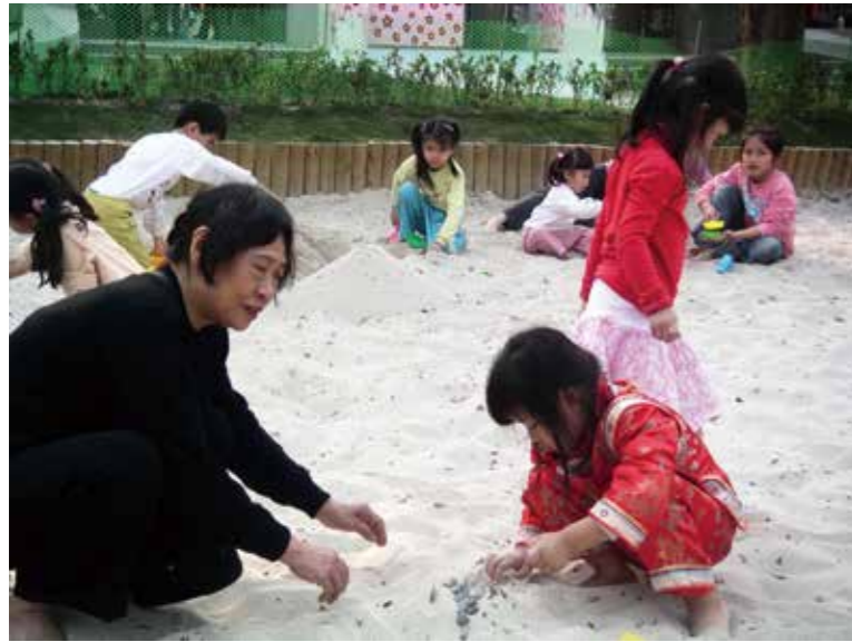
能跟家人共享天倫之樂的場域，最能吸引樂齡者。

形。可以想見，當鐵路地下化完成後，內惟新、舊社區合併，美術館社區將移入更多人口。美術館偌大園區的休憩屬性與鄰近醫院的便利，事實上已逐漸吸引銀髮族與退休族的進駐，這部分可由推著輪椅老人在園區閒逛的外傭增加，以及美術館近兩年來銀髮志工越來越多來自鄰近社區，以及私人照護中心逐步進駐等推斷。當大量銀髮族出現在美術館前，是否她已意識到這樣的觀眾層轉變，並準備好要讓自己成為他們新生活的地標？