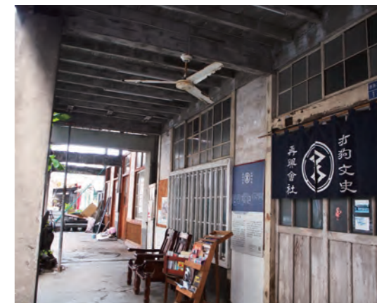
新濱老街廓的保留，見證民間文史團體文化先行的力量。

舊城在哪裡？翻開清康熙台灣輿圖（1696～1704年），在高雄左營還是鳳山縣興隆庄、愛河還是硫磺水、旗後稱岐後、高屏溪還沒有名字的年代，左營尚未建城，半屏山仍巍峨聳立。時代往後，這裡是榛莽一片，原住民各社競逐鏢獵，梅花鹿「獲若丘陵，社社無不飽鹿者」的年代（陳第〈東番記〉