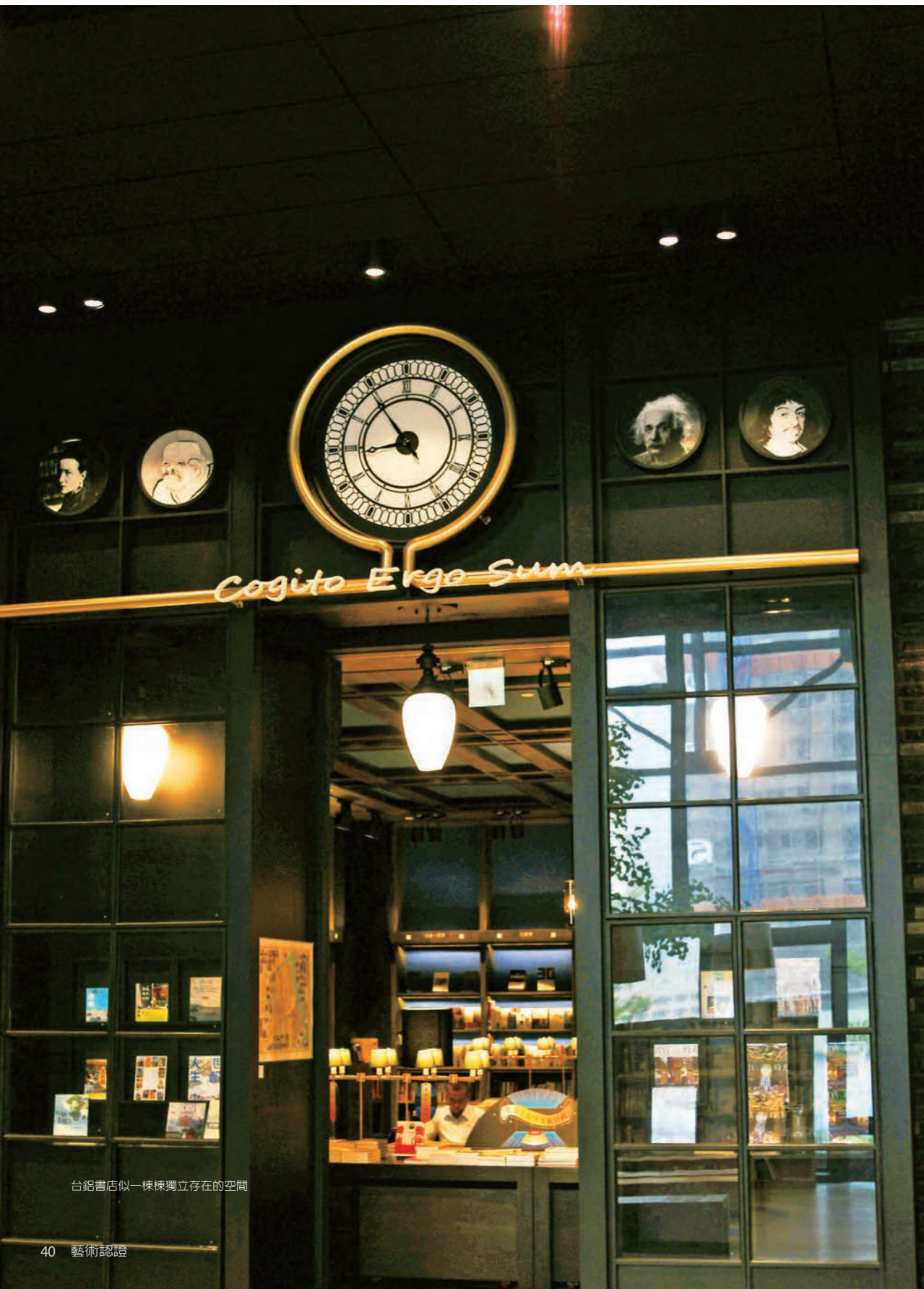
台銘書店似一棟棟獨立存在的空間