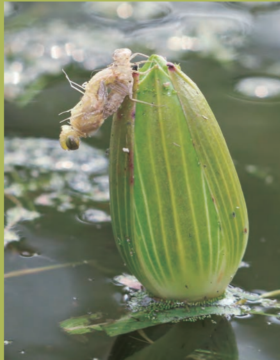
正在羽化的腥紅蜻蜓