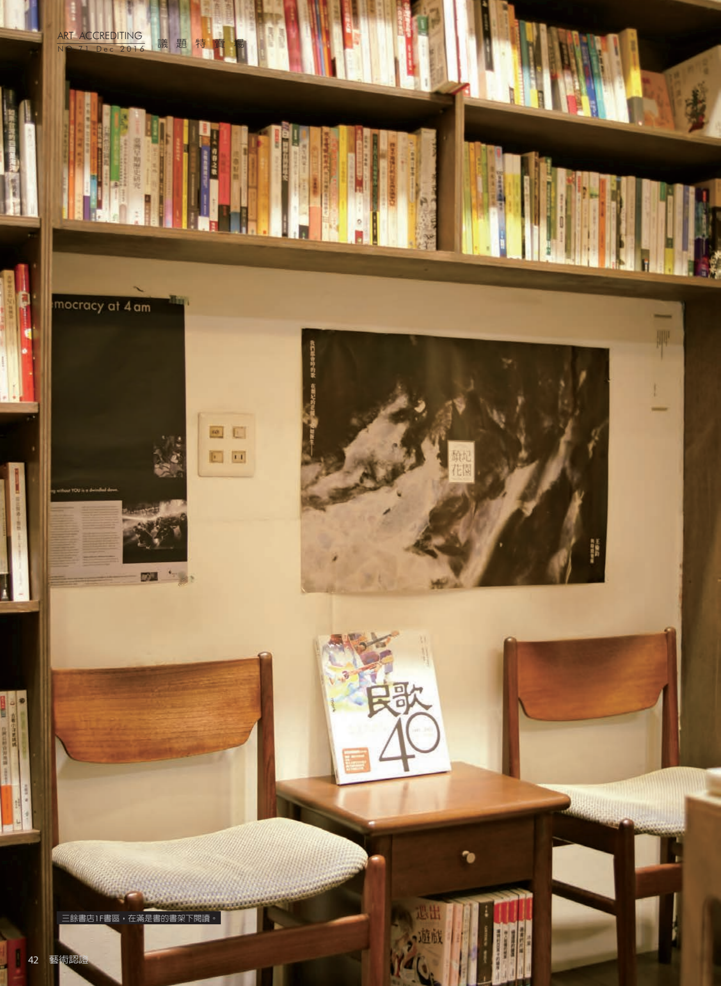
三餘書店1F書區，在滿是書的書架下閱讀。