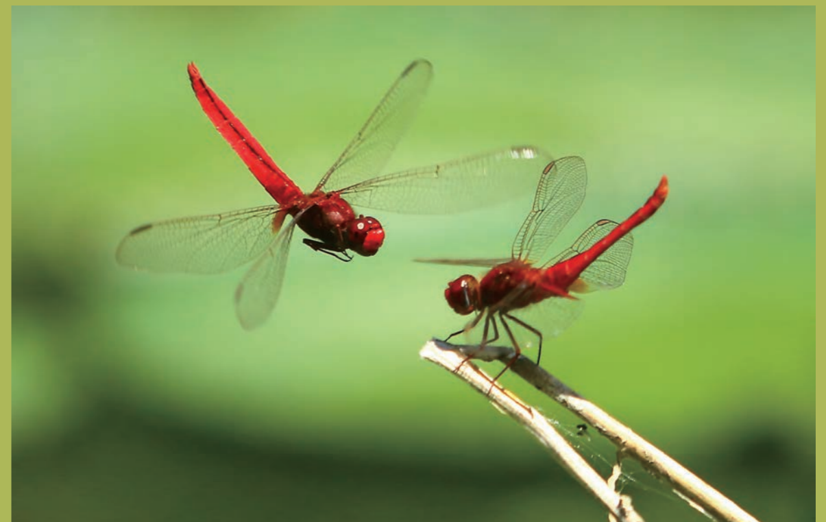
同種腥紅蜻蜓爭奪停棲點

內惟埤園區內觀察到的蜻蜓與豆娘，到目前為止有20種，腥紅蜻蜓是其中的一種，或許還有更多的種類尚未被觀察發現。一個美麗的環境需要有許多不同的物種來相襯，才能更豐富。幽靜