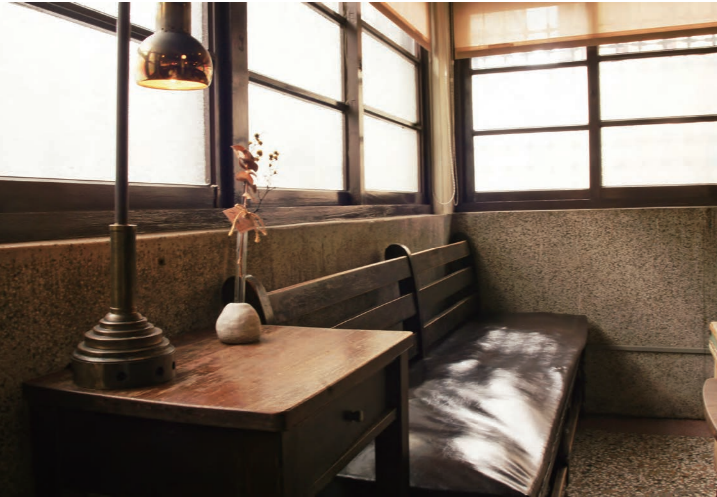
「書店喫茶·一二三亭」2樓一隅

書店喫茶的第二任老闆接手後，維持了一二三亭原本的氣氛，但在餐飲的細節上更為講究，也規劃增加和果子與咖啡搭配；販售的選書上，增加了與建築、日本飲食相關的書籍，並定期至日本尋找日系風文具、台灣設計師獨立品牌等小物。在音樂選播上，也有稍稍調整：原先多是爵士樂加上演歌，如今維持爵士樂曲風，但加入了日系清新風格的音樂，讓昭和氣氛增添了現代感。不過還蠻期待哪天能再聽見日本演歌的呢。