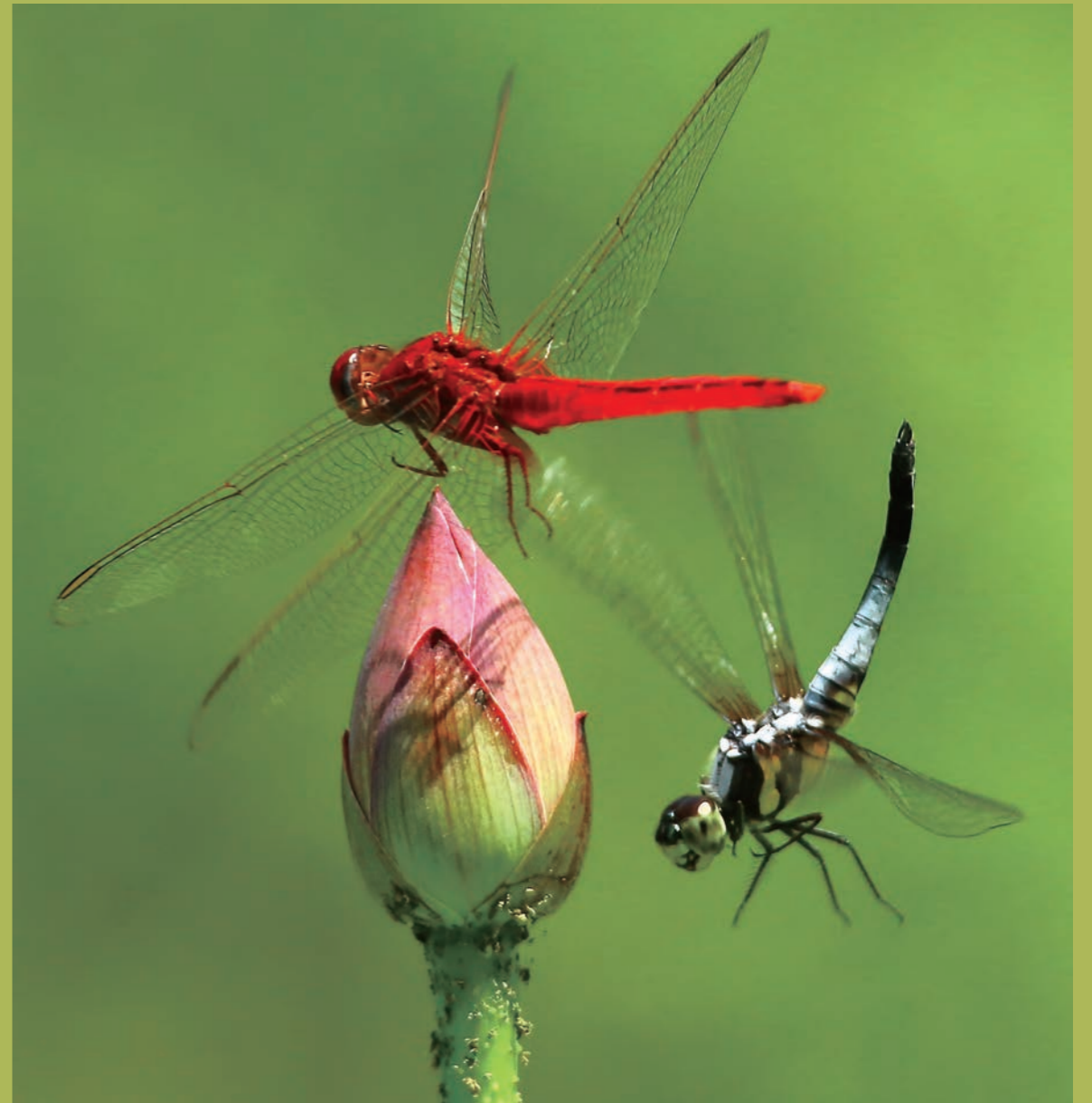
腥紅蜻蜓與橙斑蜻蜓爭奪停棲點