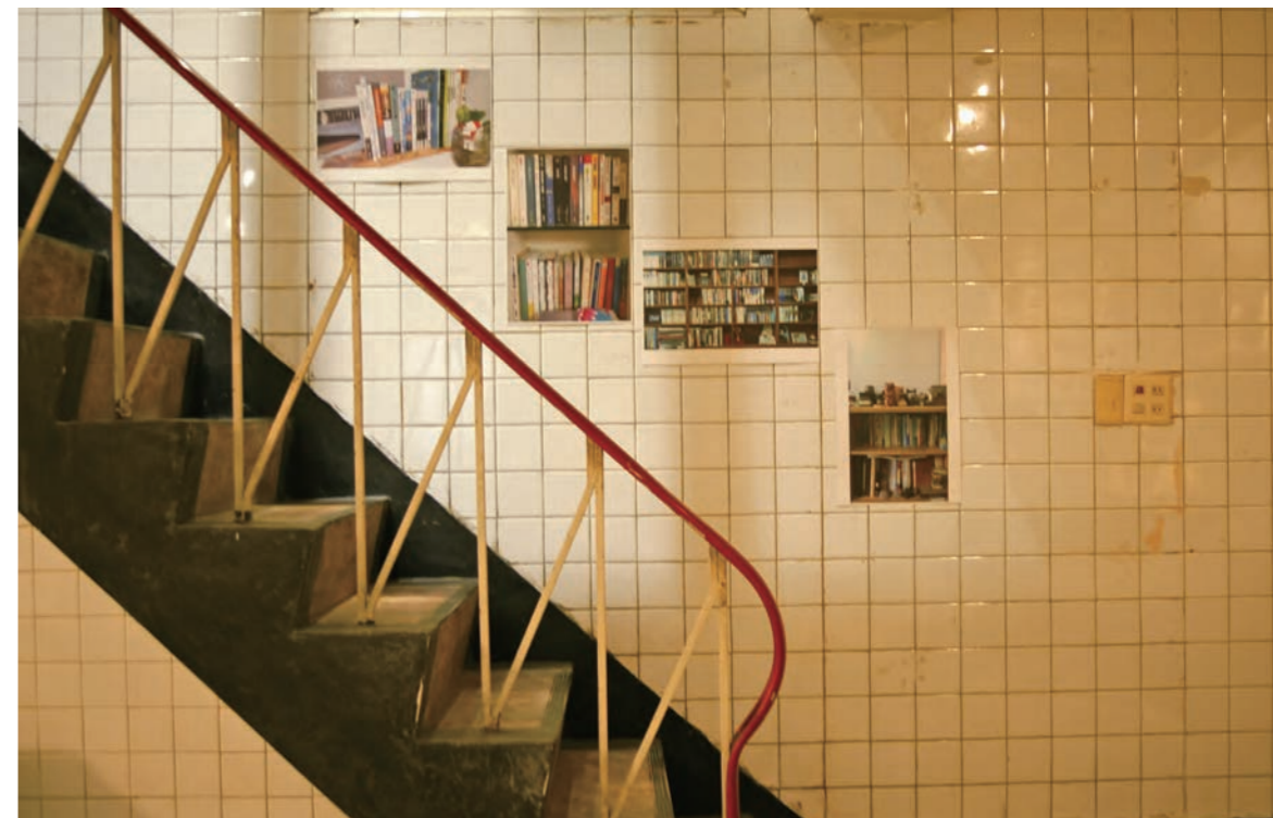
三餘書店貼滿白色磁磚的地下室，如一室秘境，是展覽空間。

本屋主家的生活場景，僅僅揭開屋舍原本的樣貌（一二三亭也是掀開天花板，讓屋頂木構造重現），就著原本的格局，切分出各樓層的經營方向，然後，貼心地在一樓入口右側牆面，張貼一張手繪樓層圖，向初來書店的讀者做一個自我介紹。家居的氣息雖已淡去，曾經是最高樓房也成了最矮小的建築，然而在書店裡可以自在翻書、坐著小讀一會兒，步入庭院望著路邊車水馬龍；或選擇和店長聊聊天，如同造訪一個愛書的朋友般自在。