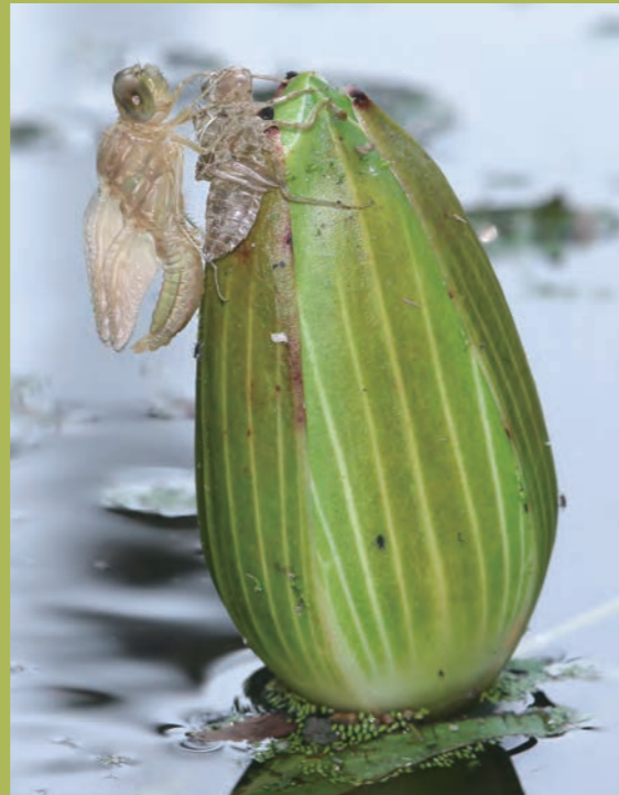
剛羽化出來的腥紅蜻蜓