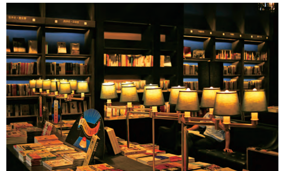
台鋁書店台灣文史書區，沈穩的藍色調與燈光。

在這裡，除了日常關心的時尚、潮流、書寫練習，以及文具雜貨之外，最好的選擇就是捧起一本書，一本書寫高雄的冊葉，讀起，遠方飛機引擎隆隆聲響，或將從字裡行間傳來。隨著聲響，80年前的高雄灣景，或有種模糊漸清晰的光景。