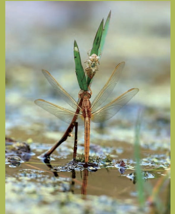
漸漸顯現顏色的腥紅蜻蜓

腥紅蜻蜓是中型的蜻蜓，體型約3公分左右，雌、雄體型大小相似，但外觀顏色則是大不相同。雄性腥紅蜻蜓的外觀是鮮艷的紅色，雌性腥紅蜻蜓則是呈土黃色，值得一提的是，腥紅蜻蜓雄蟲尚未成熟時，亦呈土黃色，與雌蟲極相似。腥紅蜻蜓除了外觀顏色的特徵外，它的翅膀是全透明，只有在翅基的部位有些許的黃褐色斑塊，翅痣黃色，腹部背面中央有一條連續的黑色，是辨識上一個很重要的外觀特徵。