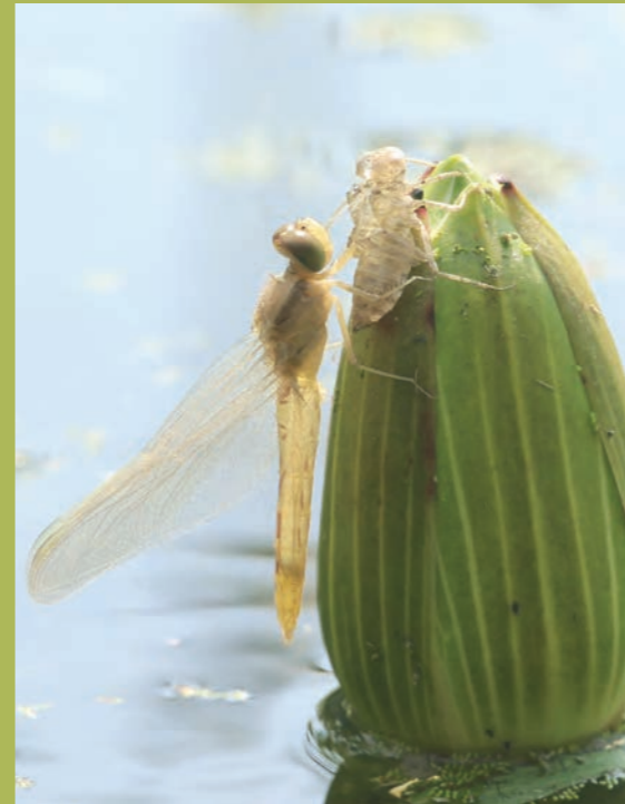
展翅成功的腥紅蜻蜓