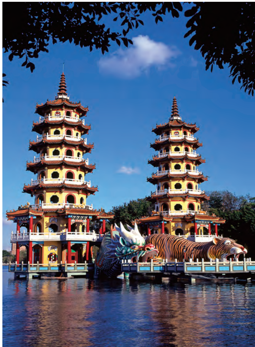
高雄地景持續變化中，蓮潭雙塔半屏山風情今昔殊異。

地圖企圖對現實空間加以客觀描述，卻只是再現，它亦象徵主宰與征服。對後人而言，則為人文及自然地貌的古老再現，它遠遠超越美好年代的寧靜停格，它出自藝術家手筆，是想像與創造的結晶。