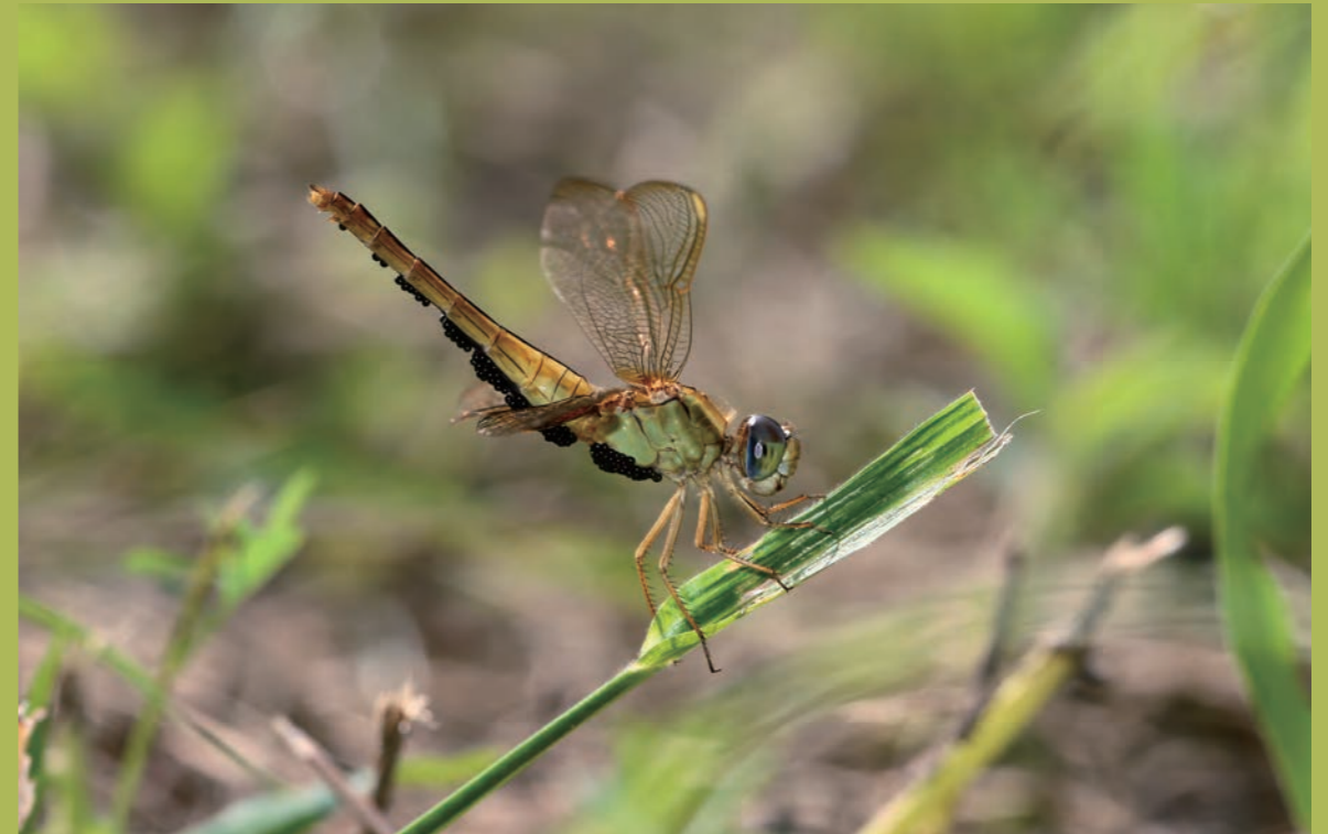
被水蠅寄生的腥紅蜻蜓雌蟲