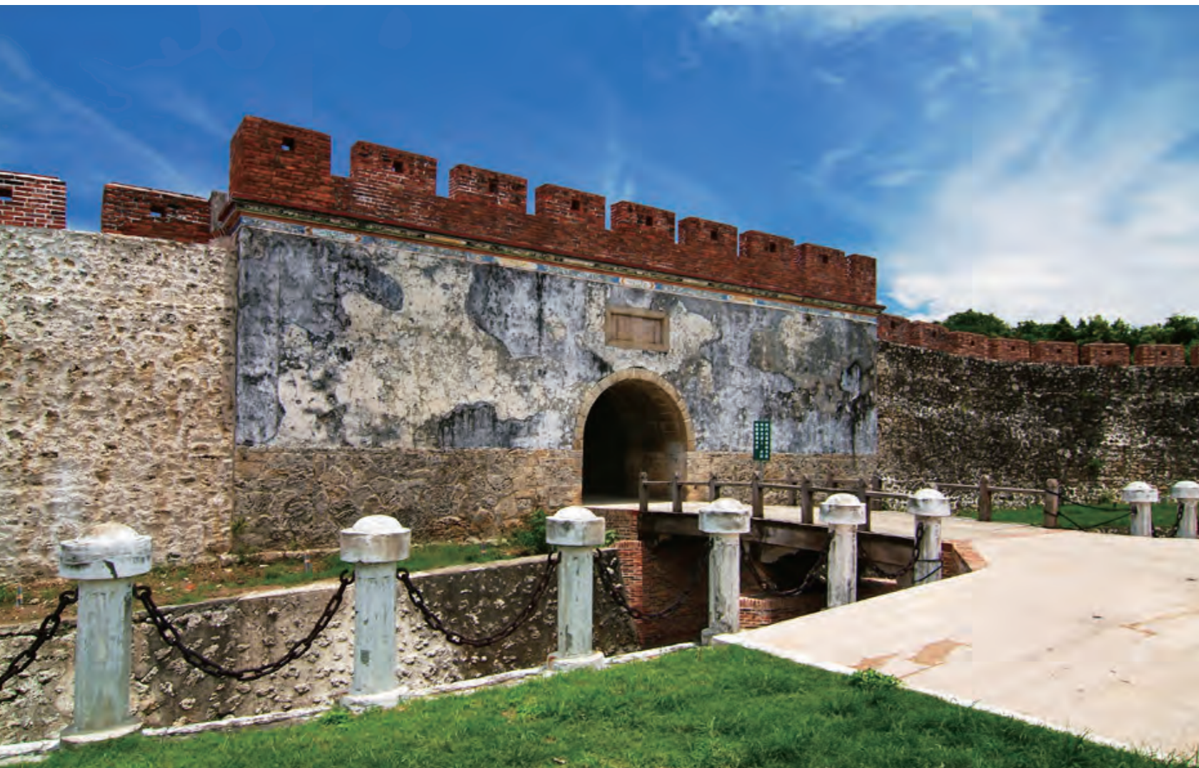
左營舊城是打狗古老的文化地景

台灣這許多年來的發展跡象顯示這一條走向人文懷舊復古的意趣之路。各地返鄉或在地年輕