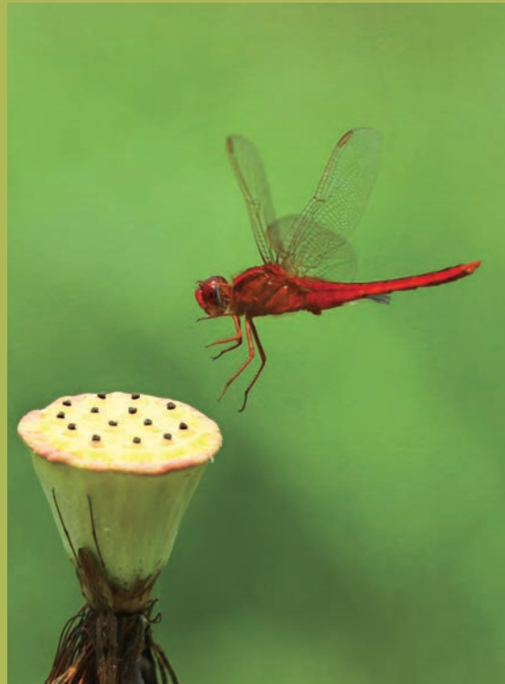
飛行中的腥紅蜻蜓