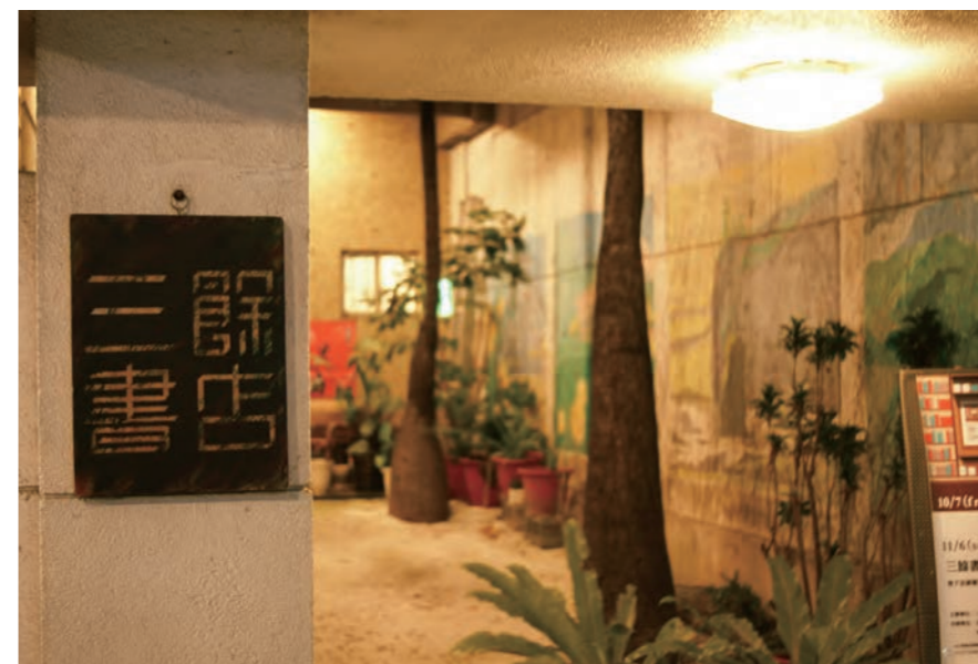
三餘書店大門與小庭院