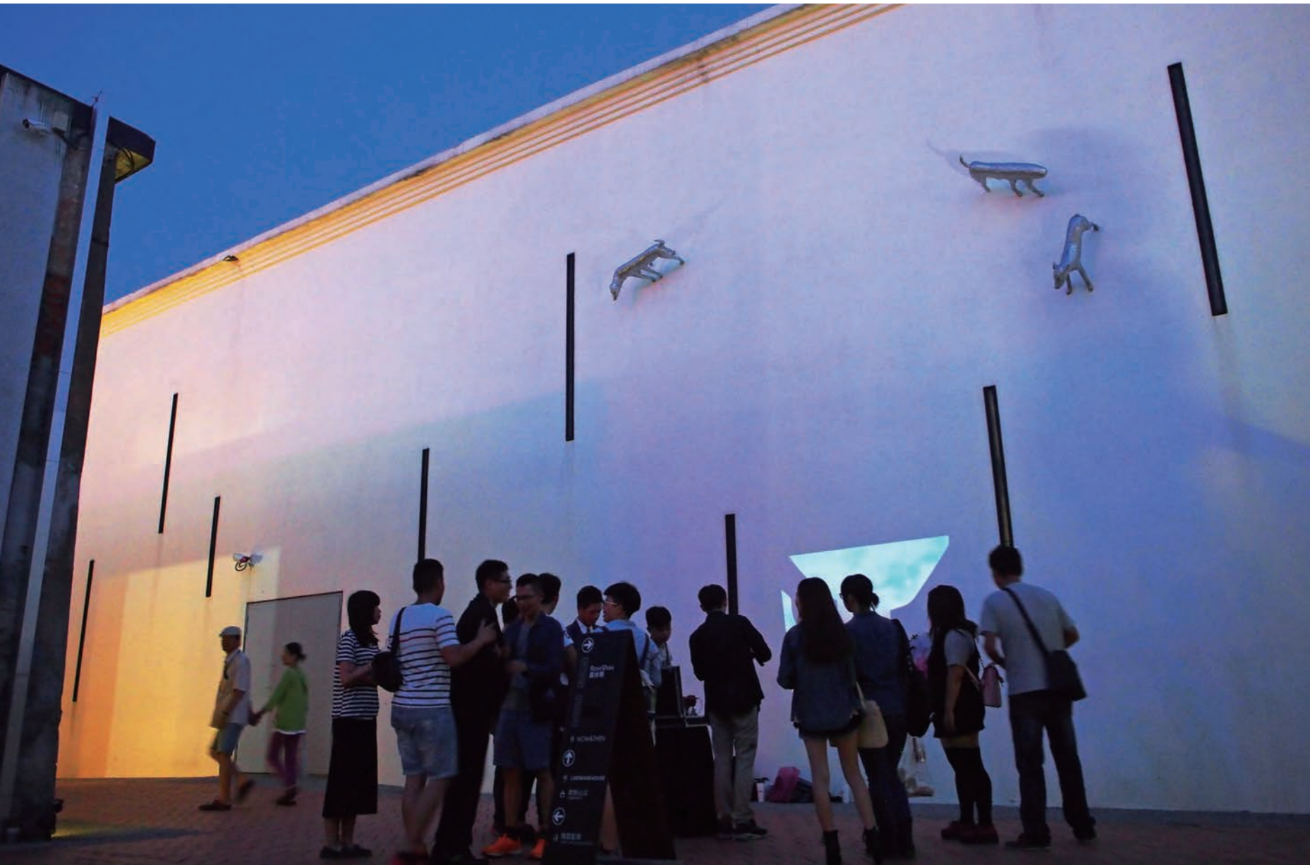
駁二文創藝術群聚效應，對年輕人充滿吸引力

屋欣力宣言」)下，夠不上古蹟或歷史建築的市區老厝古宅，經適度設計改造翻修成為藝文、文創、工坊、書局、民宿、茶坊、餐廳或咖啡等充滿舊時光氛圍的人文空間。其實，利用老建物或歷史建築做商業藝文使用的案例很早就有，像鼓山哈瑪星山形屋，幾經換手，目前為「壹貳樓古蹟餐廳」。但這一波與之前不同的是，在空間營