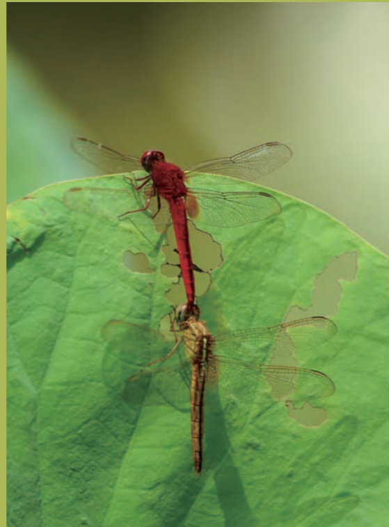
直線連接等待交尾的腥紅蜻蜓