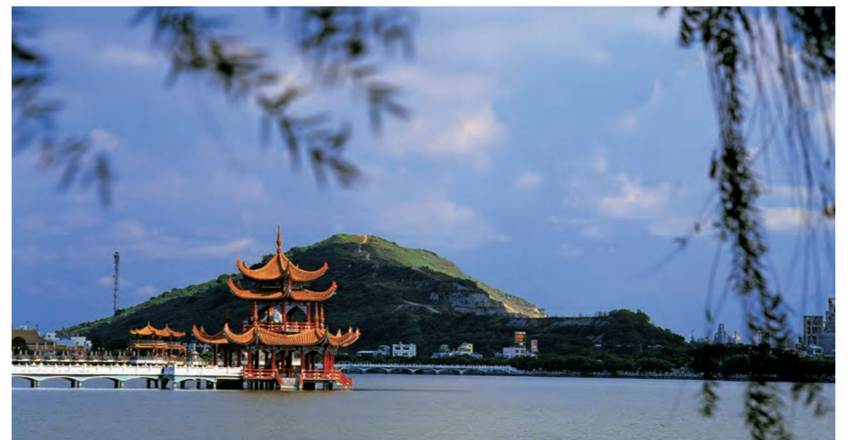
高雄地景持續變化中，蓮潭雙塔半屏山風情今昔殊異。(攝影：陳漢元)

從地圖到地景的繪製創作，文學和藝術同樣在紀錄、想像和創建地景。從文學角度同樣可以看出高雄地景的轉變。清領時期官宦文人眼中「鳳山八景」是：鳳岫春雨、龍巖冽泉、淡溪秋月、球嶼曉霞、岡山樹色、泮水荷香、翠屏夕照、丹渡晴帆(《鳳山縣采訪冊》)。除蓮池潭「泮水荷香」的文廟學宮，及「丹渡晴帆」的帆影外，盡為大自然美景。