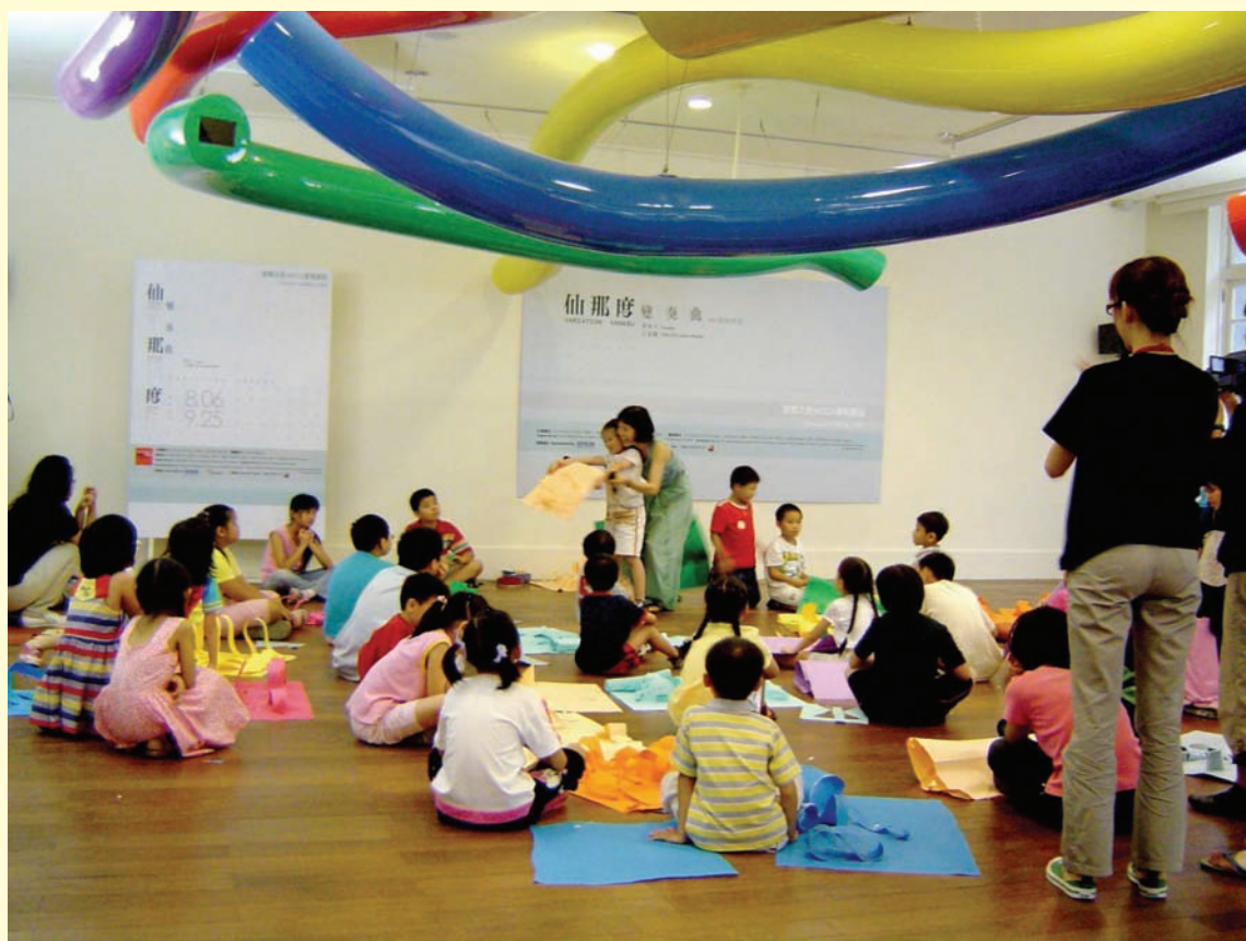
● 秀出作品、自信的表達、我的黃色城堡耶

每個人內心都住了一個尊貴無比的孩子。 那個孩子會帶領你探索、體驗、實現一個瑰麗的『神話世界』。 但一般的人們都不願相信這個世界的存在 因為他們心中的孩子早已不見