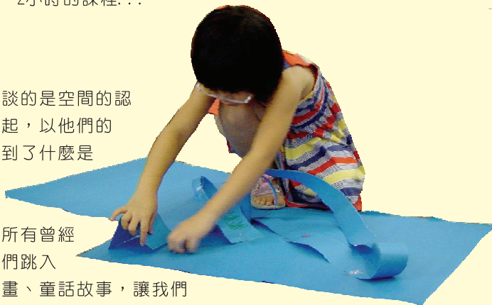
●專注空間架構中，別吵我ㄟ

音樂家、作家、藝術家、發明家、科學家，都是創造力內外空間的轉換的呈現。至於外在（物質）空間，讓孩子明白每個人都處在無所不在的空間裡，一個空間包含了另一個空間。家—台北市—台灣—地球—太陽系—銀河系—宇宙，你的血液在你身體的空間中，血液無法說“我要自由逃離身體的空間”，這樣二者都無法生存，我們必須創造一個好的空間環境—因為每個空間，都是環環相扣生生相息的，物質的空間也會轉化形體，如：冰—水—水蒸氣、花-果、毛毛蟲-蛹-蝴蝶，空間世界好奇妙Y！待小朋友有了空間的基本認識後，便開始玩遊戲囉！