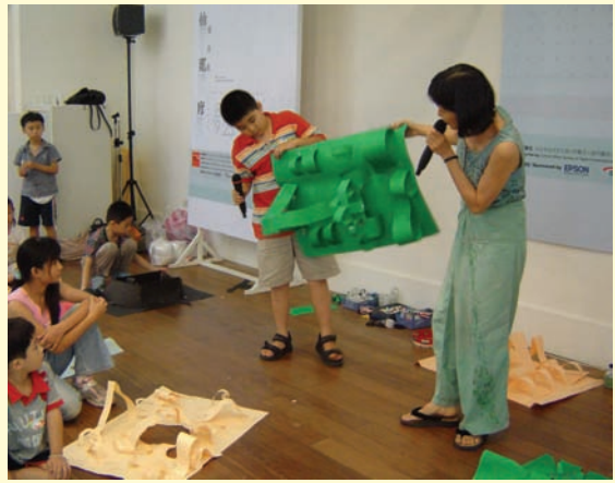
●Y, 我得意的叢林遊樂場

大人們忘了曾經也是那孩子 以至於忘了自己的創造力 孩子用天真的眼睛.探索自己的腳步 他看見 於是變成 於是擴展 實現--永遠處於最初之“新鮮” 於是你可以新鮮的活著 一如一赤子 你變成了你的天堂-----