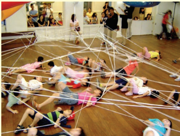
●換個角度看看熟悉的空間

幾年來，發現孩子在這種靈活創意的啟發教學下，每每臉上洋溢的喜悅和展現內心本質豐沛創造力與自信心，令人激賞！進而思考到長久教育以來，我們給予孩子一個怎樣的教學品質和環境？孩子像鏡子般，反映大人們枯燥教條式的教學，像例行公事般，連我們大人也要厭倦！那又如何去期盼一個豐富創造力的孩子？孩子一點問題都沒有呢。給予充足的養分及學習空間，提供愛，沒有長不好的種子……如果老師長期因為職業倦怠失去生命熱忱變得連自己都憎恨…那麼請放下所有事情好好讓自己享受一下，放鬆身心充充電，或重新思考：