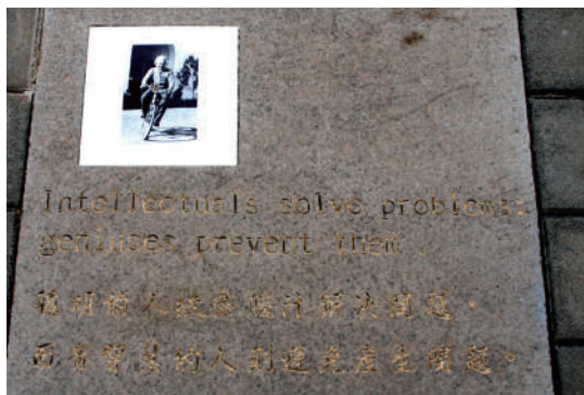
愛因斯坦生前騎腳踏車的影像燒製成磁片，鑲嵌於刻有中英文對照的愛因斯坦名言之花崗岩片。