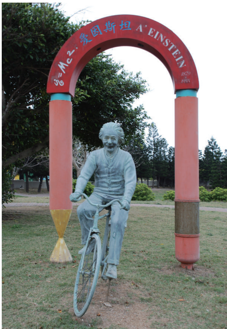
許一男於澎湖「相對公園」之公共藝術作品（愛因斯坦）

設置於馬公市觀音亭親水園區，鄰近海水浴場及西瀛虹橋之（海上明珠），融合海豚、少女、球體形象，展現在地精神與國際願景。此場域不僅自古即為澎湖名勝，亦為當今觀光、休閒、國際文化活動（例如海上花火節）要地。其海豚栩栩如生，象徵希望、智慧與海洋精神；曲線柔美、富律動美感的裸體少女象徵純潔，其舞動姿態與躍出水面的海豚呼應，相得益彰，表達澎湖「純淨」之境及「掌上明珠」意涵；少女手捧不銹