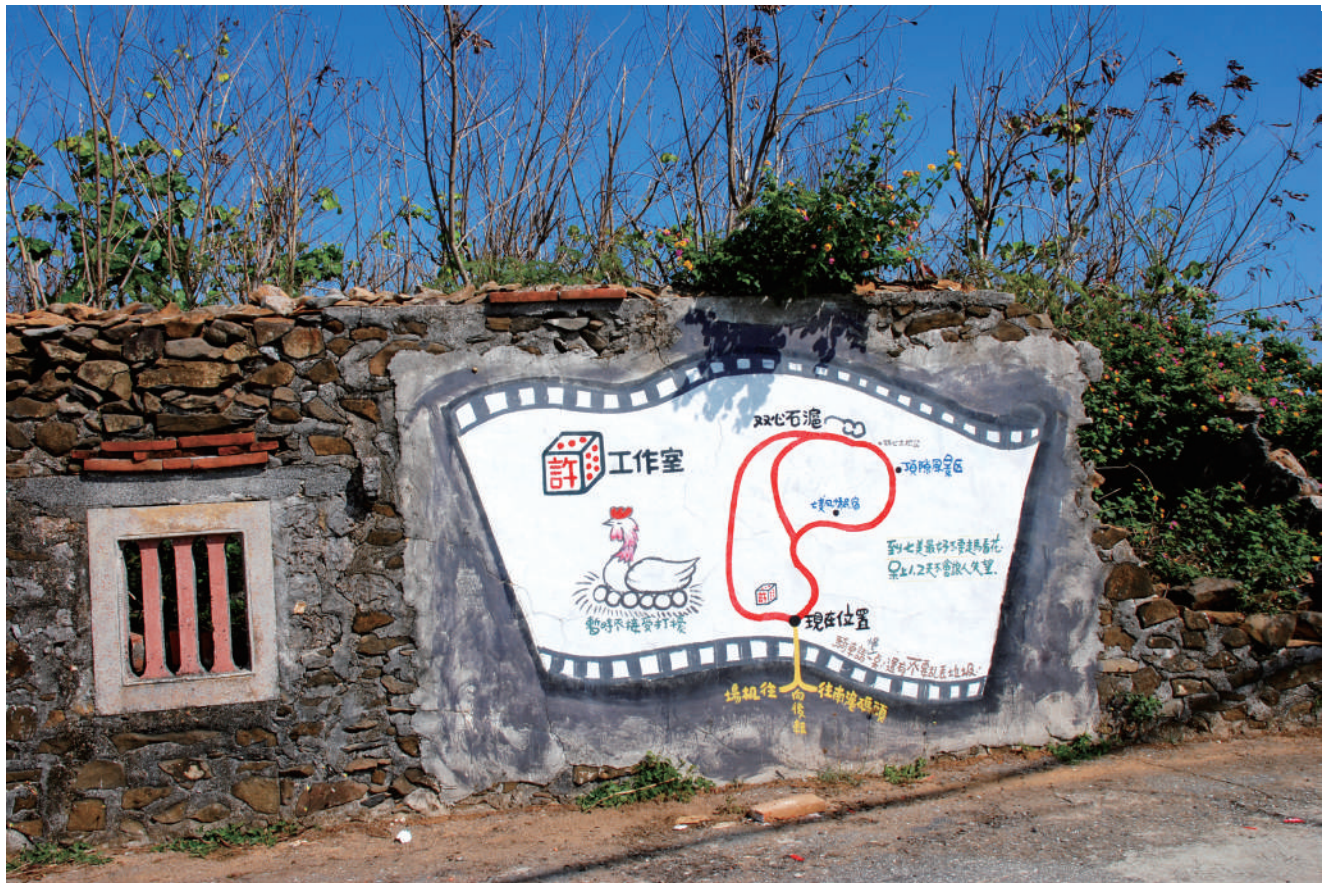
許參陸七美工作室位置圖，融合了電影、樸拙、幽默等風味。(攝影：林佳禾)

造，並呼籲深具澎湖人文特色之舊有建築，應積極保存，並保留原有風貌，再視需要賦予現代機能，如果改得面目全非，就失去文化意涵，例如馬公的中央老街和望安花宅古厝的保存即為較好案例。其另建議將澎湖防衛部舊址建築改設成立澎湖的藝術、人文博物館。如此顯見，其對故鄉藝術、文化的關懷與熱忱是全面的。