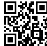
港都 e 學苑 課程教學