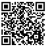
志工管理 要點與手冊