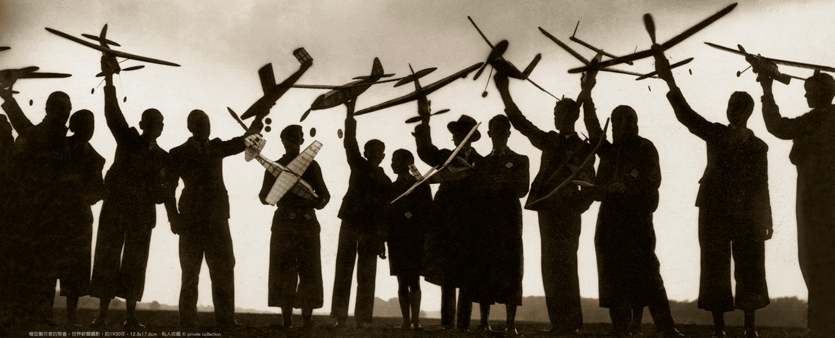
模型製作者的聚會，世界新聞攝影，約1930年，12.8x17.6cm

自2016年7月16日至10月30日在高美館展出的《看穿 每張照片都是一個謎》是由法國攝影史學者米榭勒·費佐 (Michel FRIZOT) 以其長年收藏的照片與研究成果為基礎策劃而成，是從照片中的影像著眼，進而探討攝影本質、美學與史觀之攝影專題研究展。