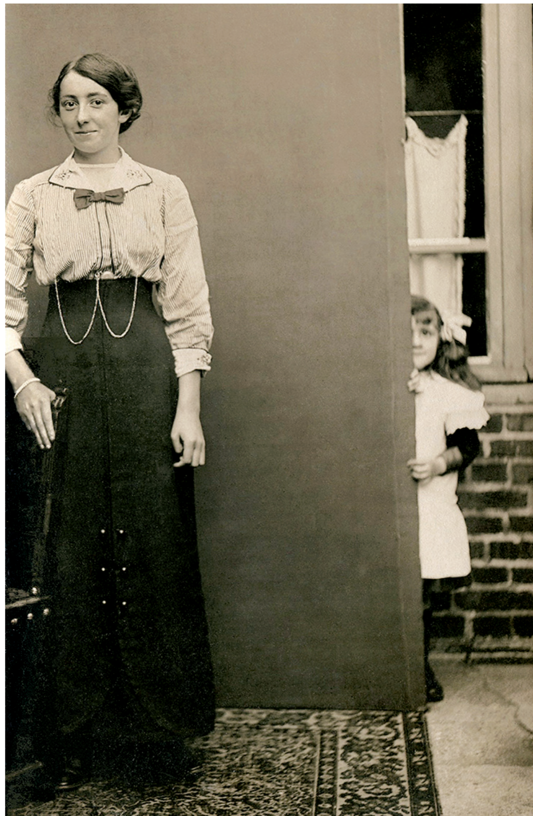
佚名攝影者，約1910年，銀鹽相紙，12.5x7.5cm 私人收藏 © private collection