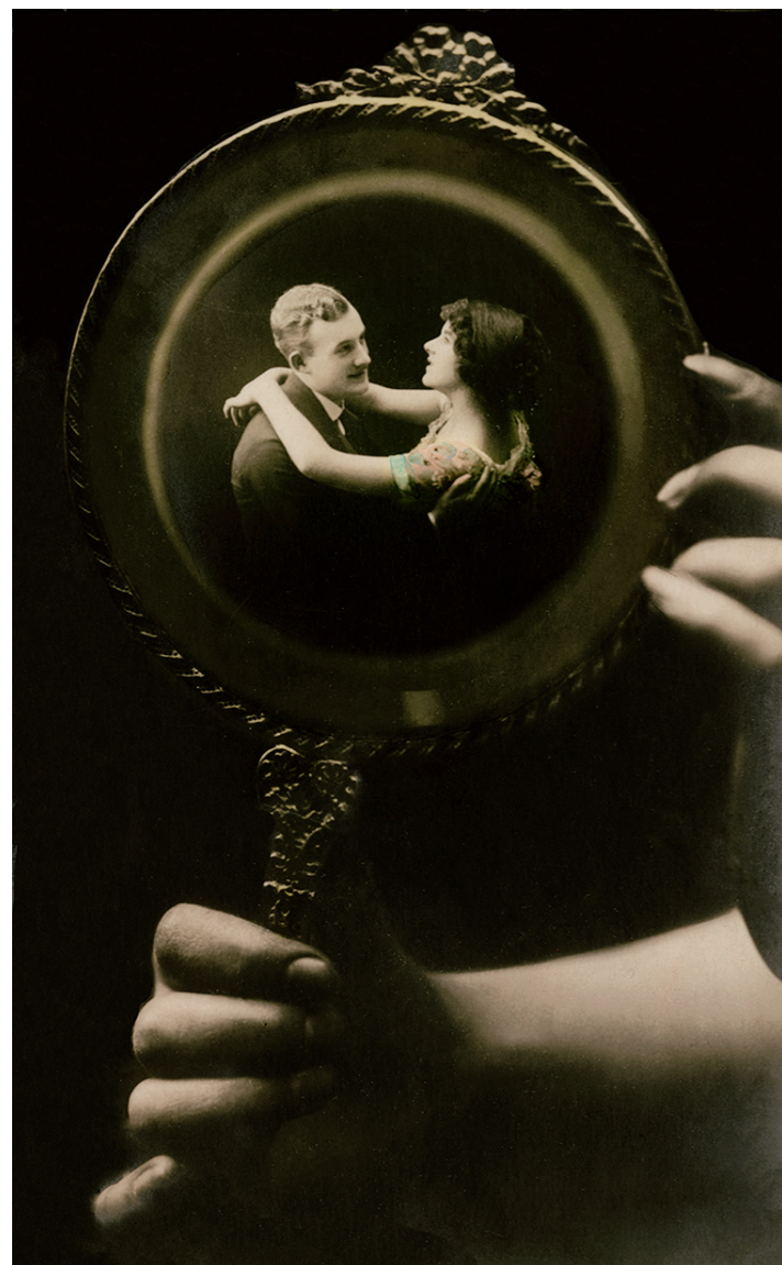
G. G. Co., 攝影蒙太奇，攝影明信片，約1920年，13.4x8.2cm 私人收藏 © private collection