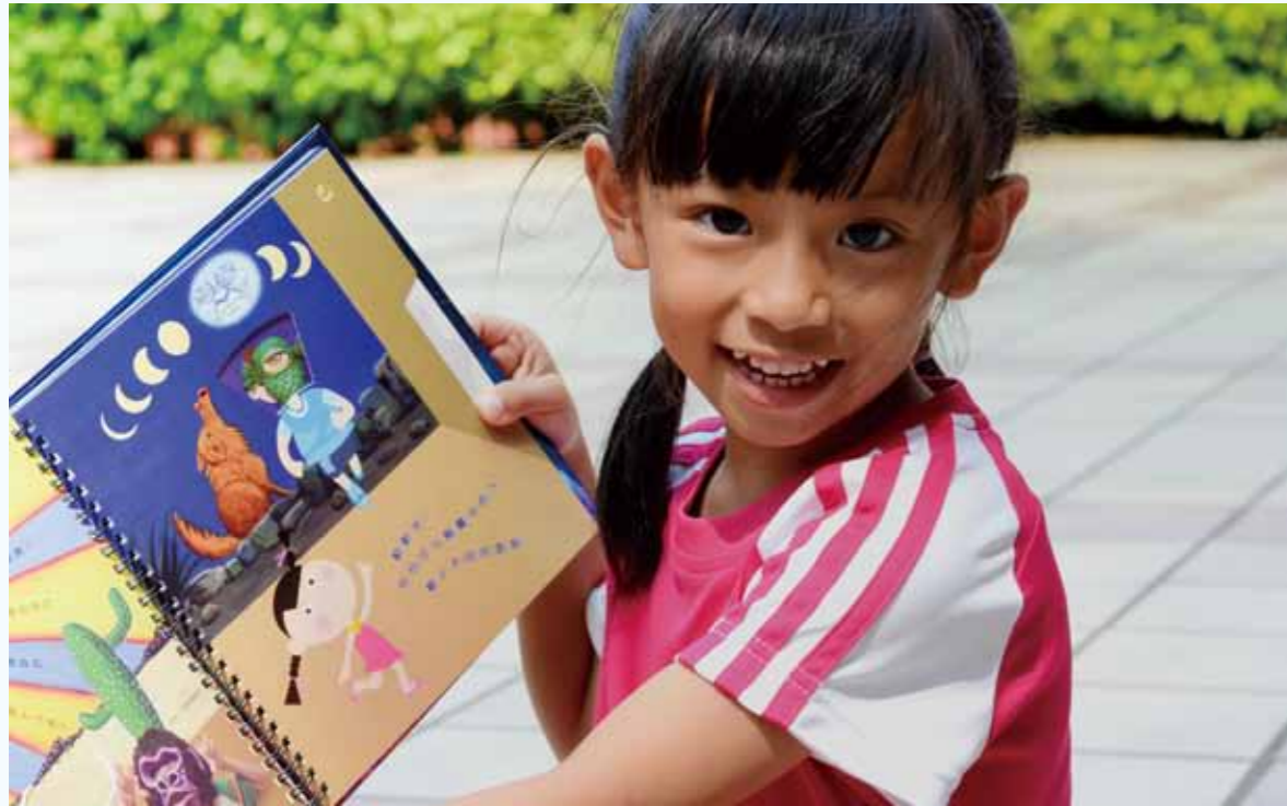
1 2 1 瞧！我幫他戴上的面具 2 《藝術運動會遊戲書》榮獲2011金蝶獎「台灣出版設計大獎」