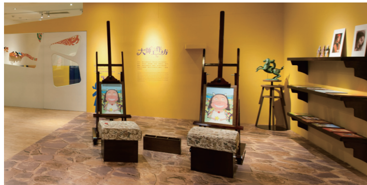
《小小蒙娜麗莎》展場一隅

無獨有偶的，國內插畫家李瑾倫找到蒙娜麗莎與貓的共同點，就是他們都有「巧笑倩兮」，所以「蒙貓麗莎」出現了，這也是一個奇妙的觀察。(圖2)我們也發現，這張圖中，貓與蒙娜麗莎一樣高雅，背後一樣有矇矓的風景……。