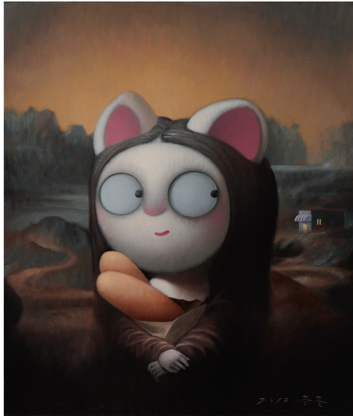
圖3 唐唐〈「萌」娜麗莎〉油彩、畫布 53×45.5cm 2013

可能英國畫大猩猩著名的繪本插畫家 Browne 對蒙娜麗莎情有獨鍾，至少在二本書中，出現了蒙娜麗莎，如《威利的畫》(陳蕙慧譯，2000)，蒙娜麗莎變成黑猩猩，而《當乃平遇上乃萍》(彭倩文譯，2001)，蒙娜麗莎卻代表中