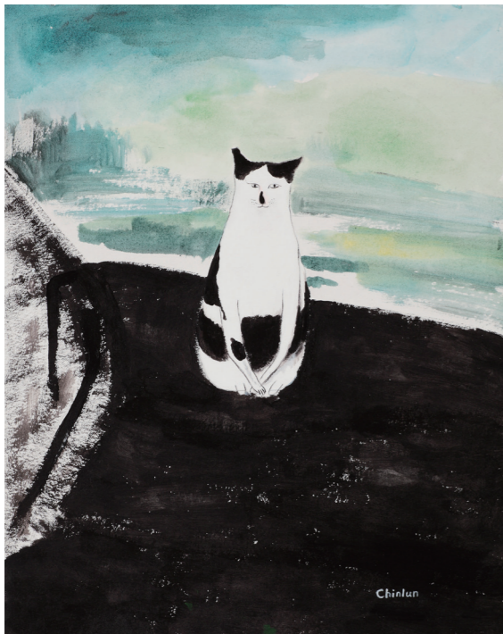
圖2 李瑾倫〈蒙貓麗莎〉壓克力、紙 50×40cm 2013

哥男明星李奧納多。有趣的是，達文西的名字就是李奧納多 (Leonardo da Vinci)。聽說他是一個天才，現代心理學者 Gardner (1993) 提出多元智能的理論，相對於傳統重視學科考試的智能，他認為人人皆有某一種智能傾向：人類的智能約可分成語文、數學邏輯、視覺空間、身體動覺、音樂韻律、人際互動與內省智能等。每個人都有自己獨特的優勢智能，但是，達文西應該擁有罕見全方位的智能，因為他不只是一個藝術家，他也是一個生物、數學與物理的科學天才，解剖人體、水利工程、航空飛行都展現他的發想與研究。Gelb (1998) 提到達文西的全腦思考 (whole-brain thinking)，即在強調他同時擁有嚴謹的邏輯思考與浪漫的想像力。也因此，他常能在平凡的事物中發現珍奇，靈光一現。