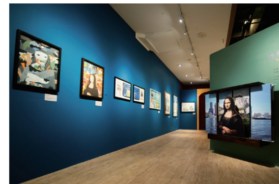
《小小蒙娜麗莎》展場一隅

蒙娜麗莎會回答：「你的方向感很好！對大小的感覺也不錯。很少有人注意到我的手，可能只有醫生有興趣，所以有人猜測我的手有水腫或麻痺了。如果觀察我的手，應該可發現我可能沒有在做