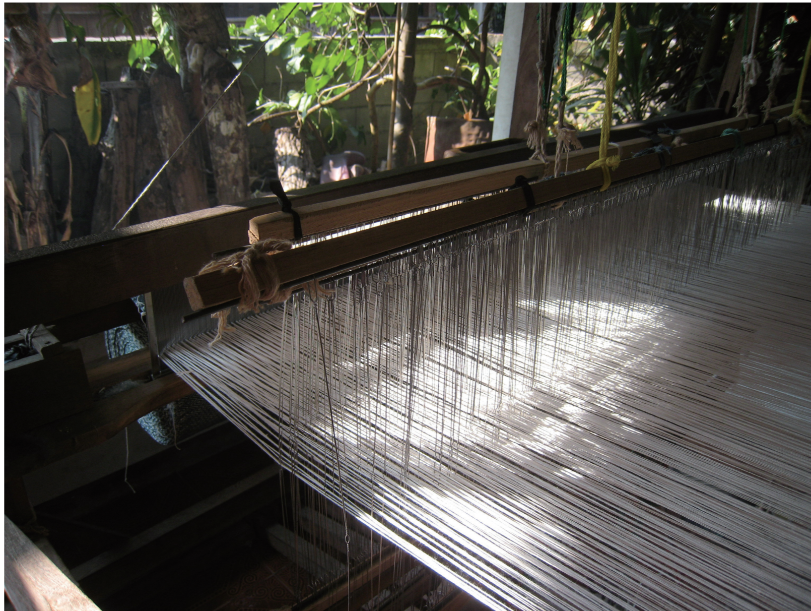
臺北仍保留傳統的手工織造技術。

透過服裝風格的借用，時尚將永恆或「經典」理想的命題與時尚本有的短暫反命題(意指：稍縱即逝的「流行」。)互相融合。馬克思主義深切影響了班雅明美學和歷史哲學。一則班雅明在前期著作建立馬克思主義的藝術理論，後期的歷史哲學則肇基於馬克思歷史唯物主義。二則班雅明一方面批判馬克思主義的歷史進步概念；然而班雅明也得自唯物主義的啟示，用經濟結構(下層建築)的變遷體現文化結構(上層建築)的改變，時尚的跳躍必