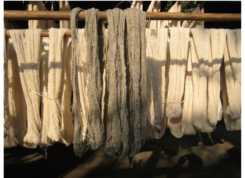
泰北吸納豐沛陽光100%純棉天然植染的紗線。

可以改善甲良族人的生活，從一根紗線的染製過程開始，100%純棉、天然植染、拒絕化學加工，所以織品本身有