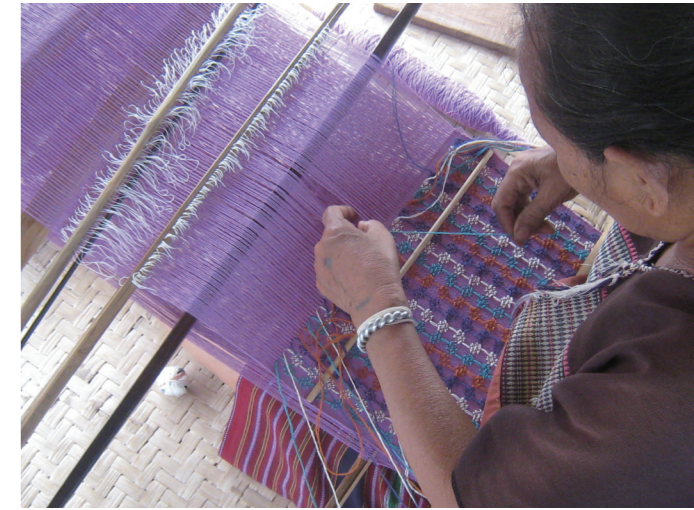
1 | 2 1 服裝設計師建構了伸展台上的風景。 2 甲良族織布的情況。

標客層與市場價格帶完全不同的品牌，在設計與創作作為上，必須做出及時性的調整與改變，否則很容易失手，時尚界這圈子裡的尖酸刻薄似乎是有目共睹的常態，呂老師可以在這行業屹立不搖三十餘年，真的是相當不容易的一件事…。