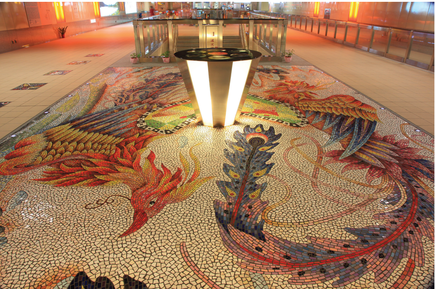
●○14鳳山國中站潘大謙作品〔鳳人緣心〕局部

次年臺灣納入清朝版圖，設一府(臺灣)三縣(臺灣、諸羅、鳳山)；清乾隆51年(1786年)發生林爽文事件，清乾隆53年(1788年)亂平後，鳳山縣署由興隆庄(左營舊城)移到大竹橋里下陂頭街(今鳳山市三民路)，成為今日的鳳山城。「鳳山」原為山名，稱為「鳳山丘陵台地」，因為形似飛鳳展翅，故名『鳳山』。「鳳山縣」就是因為境內有此山而作為縣名。這是鳳山地名的由來。