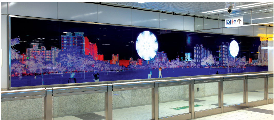
●R13凹仔底站朱宇明作品〔明日都星〕

R16左營站的〔游·戲——悠遊當代戲墨古城〕，是一群年輕人的現代數位作品。同樣是設置在穿堂層的牆面，但因充份運用現代數位影像及媒體動畫的科技，以取材自左營當地名勝「蓮池潭」的蓮池意象，加入局部動態擬真的數位效果，讓畫面同時呈顯自然與人文、現實與歷史的超現實趣味，極富人文反思的內涵。這件作品不論是