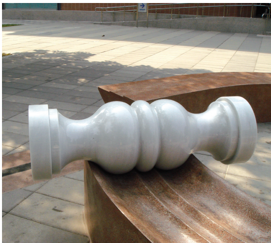
由高雄百年窯廠「三和瓦窯」的紅磚、碎片重組，成為歷史藝術物件的三座軌跡台座和匯集民衆的空間載具。

小規模的人民努力，這個小小的點會被連接成線，再成為面。終於能取回街道的活力，新大阪的歷史將要開始，連結人們的意識將成為『民的街』大阪的原動力」。