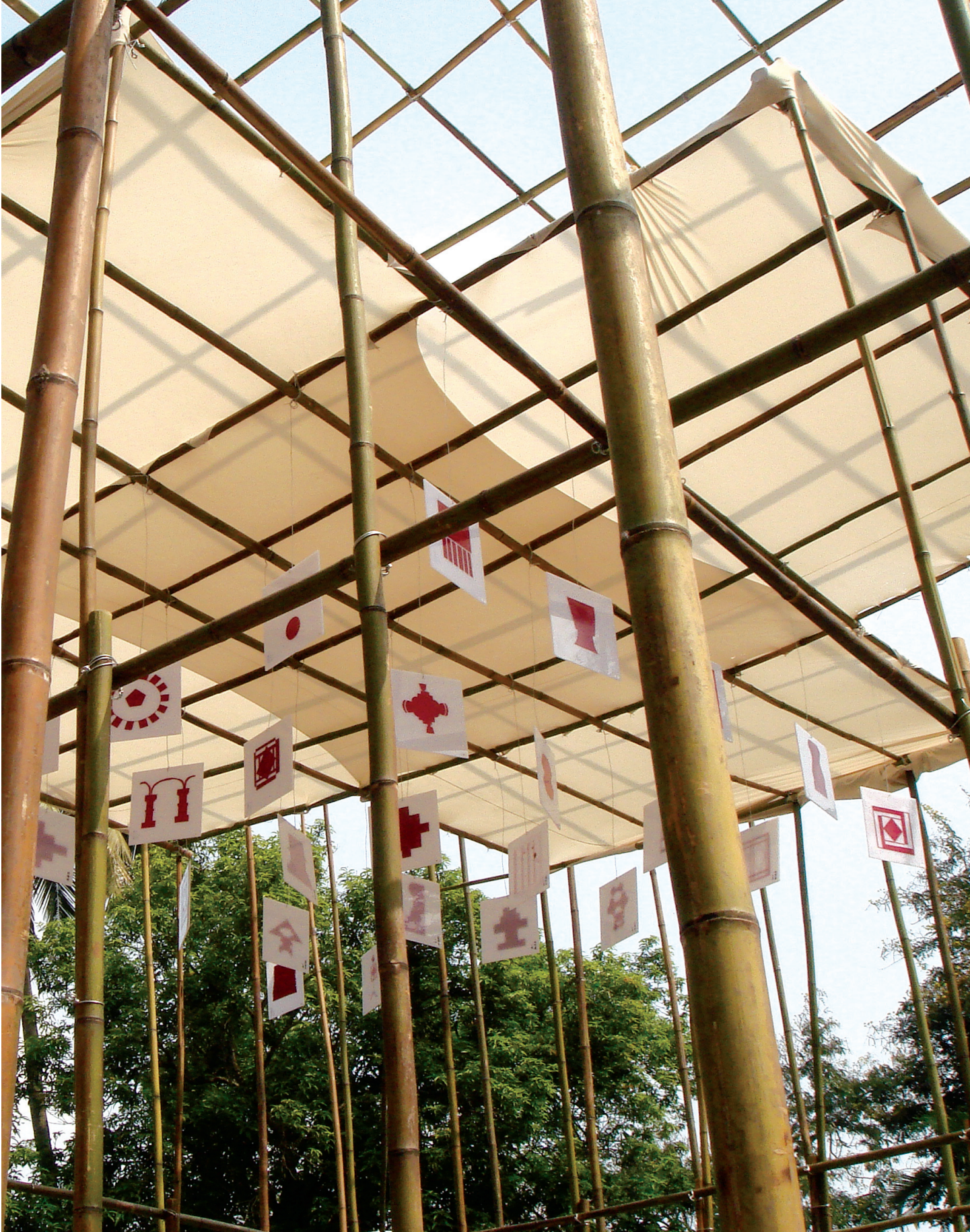
學生參與「尋找藝術的基因」活動，進行環境美學的講記勾勒，入選作品裝置在作品基地現場開放民眾參觀。