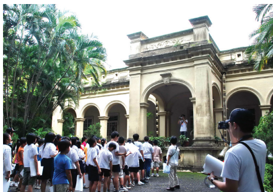
仕隆國小一百多位師生集體參與了發掘環境中美學與創意的探索藝術基因之旅。