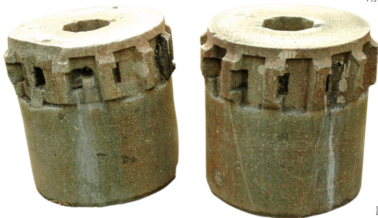
具有抽象幾何之美的糖廠內散置的舊製糖工具組件模組

作品的三個基座，選擇採自高雄百年窯廠「三和瓦窯」的紅磚碎片重新組合黏結，成為歷史藝術物件的三座軌跡台座和匯集民眾的空間載具。地上三道延伸指向場域三個空間座標的指引線，選擇分別代表廠區三種工具材質的金屬，分別是五分車鐵軌、圓形鐵管和現代建築用角鋼，以樹脂封存於地面下，管道的兩翼隱藏 LED 光源，於夜間透過鐵件的線性，將環形的藝術裝置由中央引向微暗的三個林中方向。