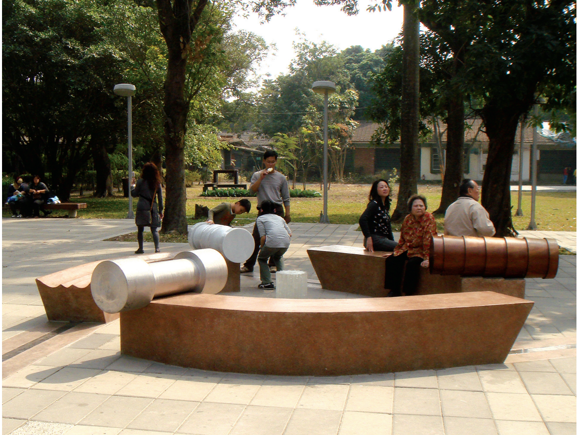
在共鳴之中，我們「聽見」了詩，但處於迴盪之中，我們「訴說」著詩，詩化入我們自身。參與者化身成為場域中的詩人。

在橋頭糖廠現場，分發30公分×30公分尺寸模造紙畫紙，於講解後由亞洲大學創意設計學院研究所學生以及仕隆國小老師、志工帶領分隊，進入糖廠及周邊社區進行發現與創意創作。許多參加者攜帶各種測量描繪的工具（例如：尺、鐵線…等創意工具），運用自身敏銳的觀察力，重新發掘橋頭糖廠周邊環境中的造型與色彩，轉化成自己的基本幾何造型中文化基因元素創意樣稿。