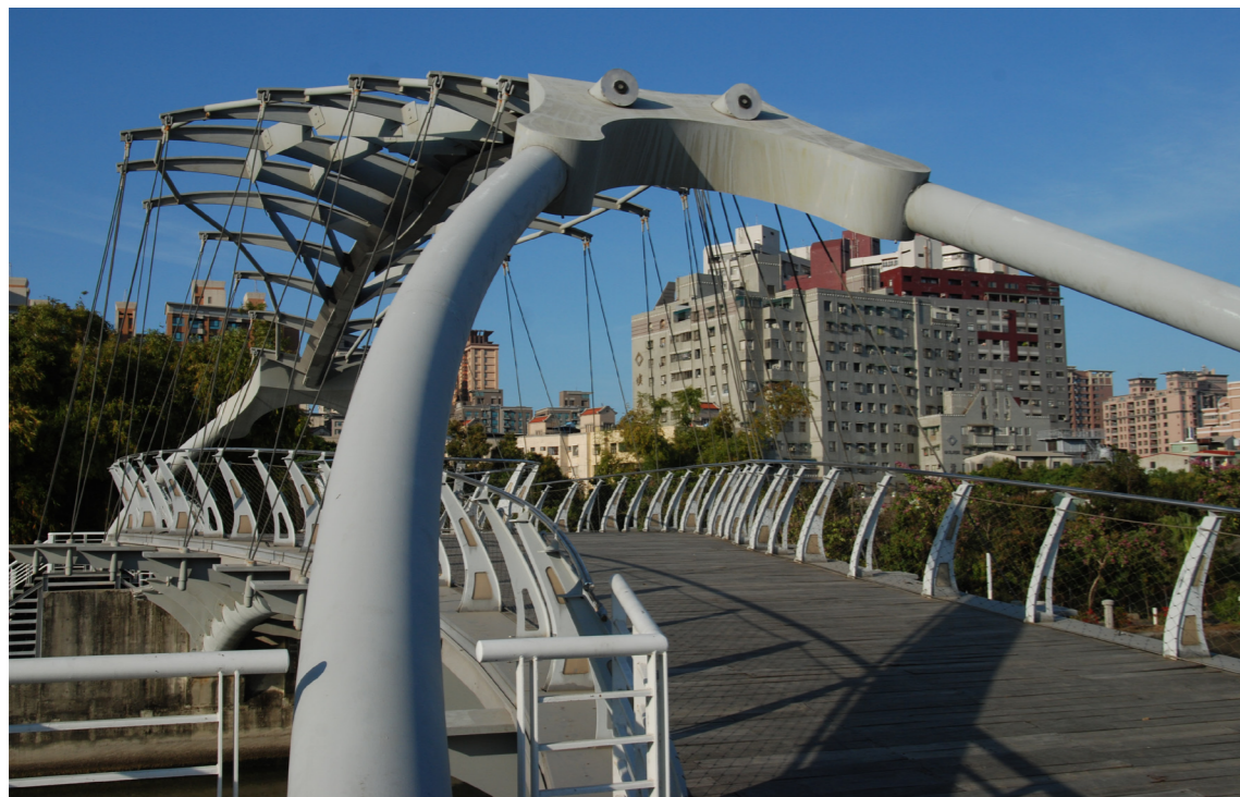
● 座落於愛河同盟路段光之塔旁之陳明輝作品〈生命的躍動〉

台灣高雄自來水公園原為閒置於光華路與五福路口的土地，長約100公尺，寬約98公尺，基地內有建於1960年的大水塔。2003年高雄市政府工務局將之開發成緊鄰社區的主題公園，自來水公園藉著引進公共藝術裝置，提供了在地藝術家參與城市景觀營造的舞台。園內共有七座公共藝術，處處可見以「水」、「流動」為主題的環境