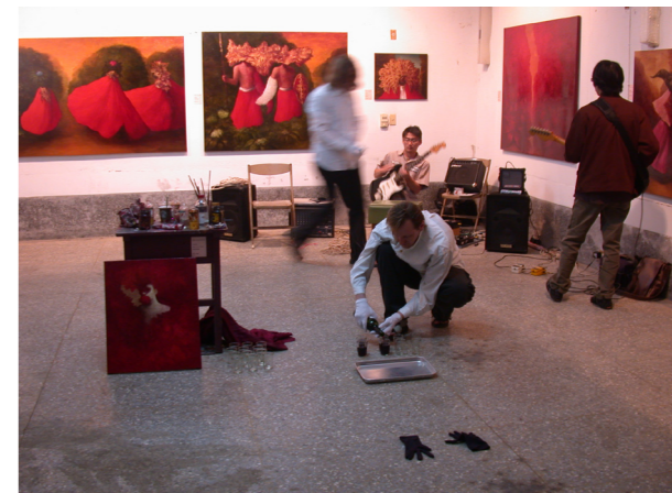
● 橋仔頭糖廠藝術村第七期立陶宛藝術家Sigitas Staniunas進駐邀請台灣音樂工作者跨界發表作品。

有志於成為專業藝術創作者的人，不論國內外一般而言所採取的正規路線是進入相關藝術科系，加上現階段國內各項獎助的機制重心是在於年輕藝術工作者，若想成為專業的主流藝術創作者的話，如同過去處於「省展」時代，晉升管道是獲得省展獎項的加持與永久免審查的榮譽；而當下最佳捷徑也是從學生時代便獲得台北或高雄美展大獎的榮譽，獲首獎者不僅可獲得策展人與各方的注意也同時建立了知名度，雖然還在校園中就讀，便已開始有各種展演邀約或是畫廊代理；同時文建會與各基金會有許多對年輕藝術家的補助計畫，或是提供國際上藝術村的進駐管道……也就是說若成名無法趁早，也錯過了藝術學校與公部門的認證，想要成為專業創作者，便需要獨自走不同於主流的崎嶇道路。