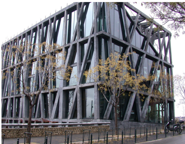
● 法國普雷羅卡普雷羅卡「黑暗亭台」(Le Pavillon Noir de Preljocaj) 提供當代舞蹈專業進駐現地創作暨展演用途。

位於法國南部的普羅旺斯-艾克斯 (Aix-en-Provence)，兼具舞蹈進駐創作暨表演廳的功能。黑暗亭台提供當代舞蹈專業進駐現地創作暨展演用途，也是法國唯一最專業提供舞蹈工作者現地創作製作舞碼發表之處，力求呈現藝術創作的過程與演出的實際狀況貼切，空間基本上就規劃了排練室與表演廳一樣的尺寸，空間極簡、廊道有機的穿過排練場銜接不同的空間，不浪費空間也節省許多資源，謙虛而實用的考量體貼藝術家的需求，在此完成的作品由黑暗亭台典藏舞碼，有非常專業的公共關係小組建立黑暗亭台本身的國際網脈，並透過此專業平台積極協助舞團國內外巡迴發表奠立基礎。