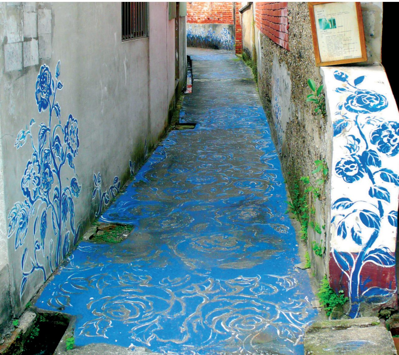
● 梁任宏的〈青花巷〉