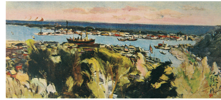
●港口 小澤秋成 1933 明信片

而為了讓台灣島民能快速認識日本產業、經濟、文化…等，從1897年在淡水首次舉辦介紹日本物產的博覽會，即陸續於各地舉辦，內容包羅萬象，