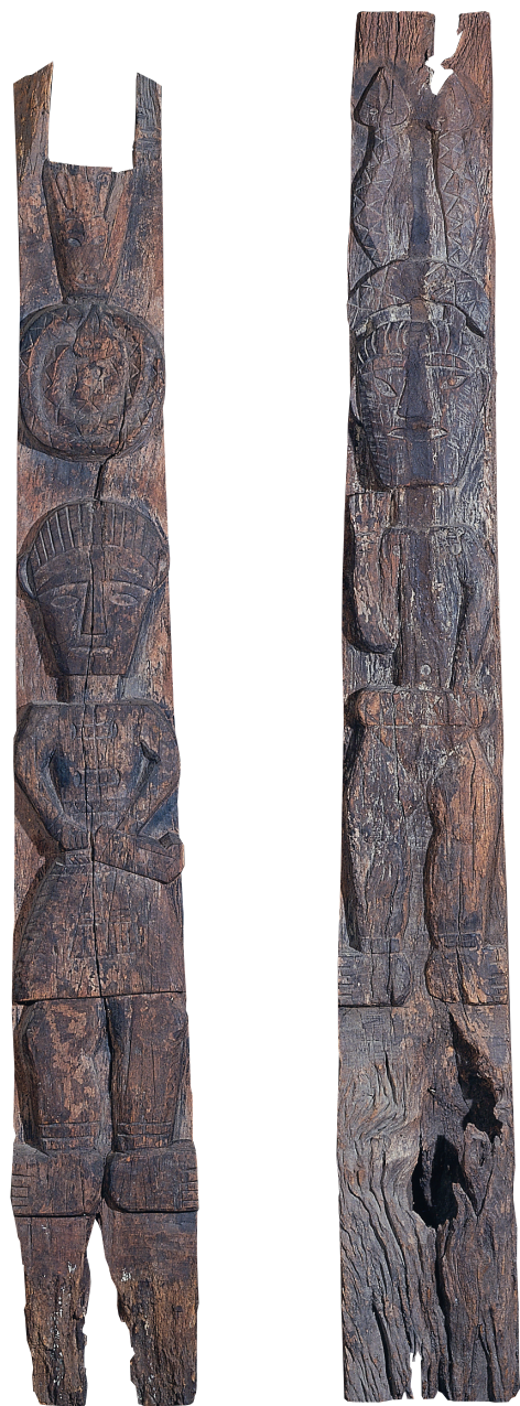
● 排灣族木雕祖先柱，高雄市立美術館典藏。