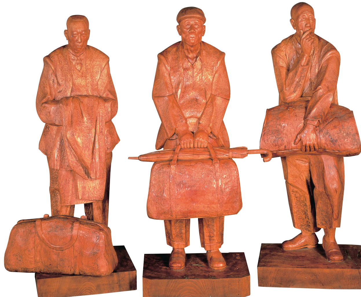
● 陳正雄〈望鄉〉，1992，128x48x42cm，高雄市立美術館典藏。