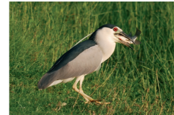
5 滿滿的一大口還真的不容易下肚