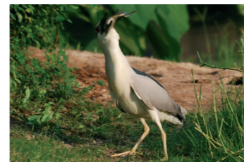
7 這招是跟漁人伯學的「吞劍」