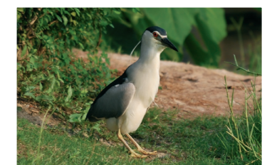
12 大肚子??拜託人家還未婚啦