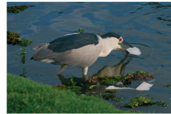
1 放好釣餌，等魚兒上勾