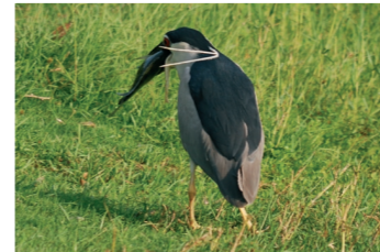
4 好不容易上勾的魚兒可不能讓她跑掉，還是往岸上移動安全些