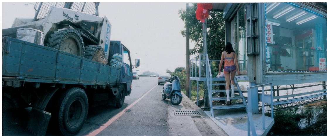
● 陳敬實《片刻濃粧》攝影 110×110cm 2005

遮掩下，她們其實面對著跟我們類似的問題，無關道德無關是非，只是生活中的需求與情感。