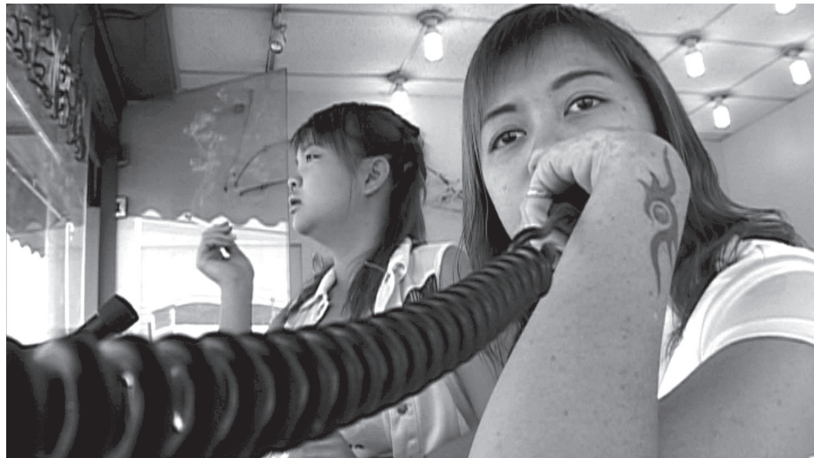
● 黃庭輔《黃屋手記》53 min.紀錄片 DVD 2006

進程中，並非徒然僅是今日我們所認知的代表「惡習」、「髒亂」、「癌症」，甚至是道德精神層面的「低俗」、「犯罪」與「色情」。