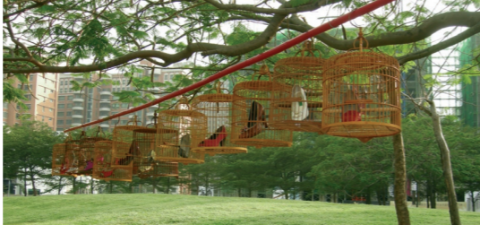
● 吳瓊華《檳榔西施系列—待價而沽、驚艷台灣》複合媒材 34×34×60cm×11 2000

鄧文貞長期以來一直以食物為其創作的重心之一，她從食物所引發的味覺、觸覺、視覺等五官的滿足，延伸到心理的渴望，檳榔與檳榔西施的結合恰是