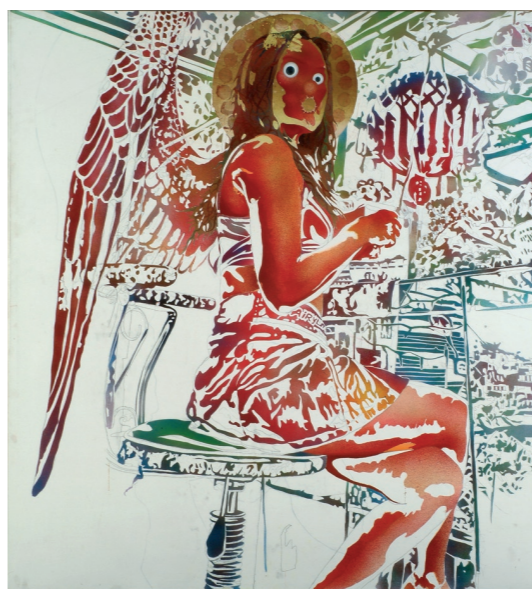
● 林慶芳《聖台妹-天使系列2部曲#10（小愛檳榔天使10號）》油彩、壓克力、麻布、霓虹燈管、噴漆 175×160×11cm 2007