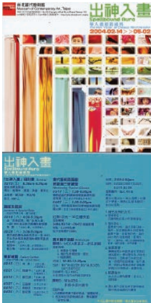
●姚瑞中、朱其於台北當代藝術館策展的「出神入畫-華人攝影新視界」(2004)