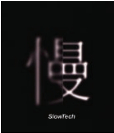
●袁廣鳴於台北當代藝術館策展的「慢」(2006)

除了資源豐厚、後盾綿強的大、中型展出外，一些獨立策展人也躍躍欲試，例如由呂珮怡策展的「錯速-錄像裝置展」(2000)，以有限資金提出失速迷眩的媒體現像。陳永賢、胡朝聖、呂佩怡等人策展的「夜視·台北-國際錄影藝術展」(2003)，則採類似「粉樂叮」的操作模式，意圖將錄影藝術溶入具有生活機能的空間中對話。姚瑞中策展「金剛不壞-台灣當代行為藝術錄像展」(2003)，首先透過錄影的紀錄性與後製性，將現場行為藝術作了史觀的整理與播映。此外，聲音藝術近期也慢慢出現，例如自2003年連續舉辦幾屆的「腦天氣影音藝術祭」，或姚大鈞策展的「台北聲納2004-國際科技藝術節」(2004)，透過國際交流與論壇方式，將原本地下化的電聲與噪音置於檯面。而由在地實驗策展的「異響-國際聲音大展」(2005)，接續擴展聲音藝術之概念，賦予原本處於邊緣性質且被窄化的聲音藝術重新定位，也試圖建立一套學術基礎，逐漸累積一定觀眾與創作人才，進一步拓展了媒體藝術的格局與認知。