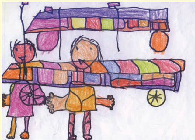
●主題：我小時候的樣子

美國圖畫書的研究先驅，貝德在《美國圖畫書》這本巨著中，鄭重的為圖畫書下定義：「圖畫書包含文字、插圖、以及整體設計，它是一種人為製品與商品，社會、文化、與歷史的記錄；最重要的，它是孩子的一種經驗。」這種藝術形式的存在憑藉著；圖像與文字的相互依存、左右兩頁的同時陳列，以及翻頁的戲劇效果…。圖畫書本身即有著無限可能。是一種人為製品與商品，社會、文化、與歷史的記錄；最重要的，它是孩子的一種經驗。」這種藝術形式的存在，憑藉著圖像與文字的相互依存、左右兩頁的同時陳列，以及翻頁的戲劇效果…。圖畫書本身即有著無限可能。