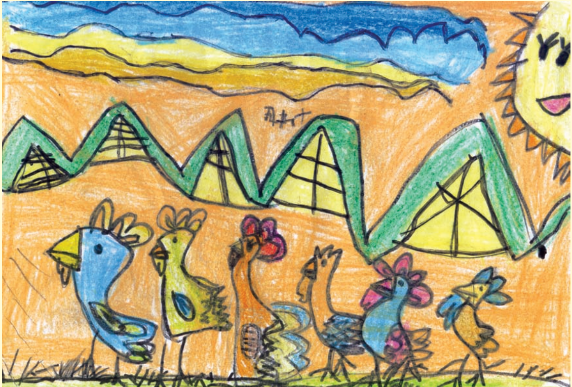
●主題：想生金雞蛋的母雞

很多的嘮叨（遊戲規則）。當然也有更多放手的機會，因此園內的孩子跟著主題活動，看見新奇有趣的事物，跳脫大人設限的知識，展現強烈的好奇心與表現慾望，園內沒有特定安排的美術活動，只有學習區提供參考使用的資料，不教孩子怎麼畫，只提供重點性的建議，我發現園內的孩子因為混齡式教學的關係，孩子所表現出來的能力是大人所不能比擬的。除此，我希望家長們是以一個學習者的角色陪伴孩子，為了讓家長們在孩子成長的過程有參與互動的機會，我們會設計一系列與主題活動相關的學習單，讓家長們知道自己的寶貝正在學什麼，需要多少協助，也讓家長們有機會參加園內情境佈置的活動（請他們提供相關的主題資料）。