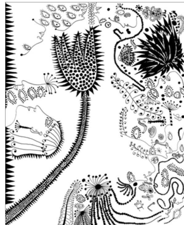
2005年作品《Flowering New York》©YAYOI KUSAMA

新作品形式「乍現」（Happening，又稱偶發藝術），由於創作主題與嬉皮文化有所共通之處，故而那些解放身體政治的大膽演出與在人體上畫點點圖案的動作，獲得壓倒性的支持，並在大批記者報導，以及往往於警方取締下收場的輿論推波助瀾中，引起強烈的迴響，更被封上「嬉皮女王」（the Queen of the Hippies）的名號。