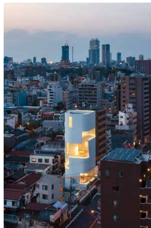
位於東京新宿區的草間彌生美術館（攝影：Masahiro Tsuchido ©YAYOI KUSAMA）

觀完單程路線的指示標誌、美術館的字體符號，以及主視覺衍生的周邊設計如工作人員制服、購物袋等，其中，以白色圓點圖案構成的透明購物袋，除了呼應藝術家的代表元素之外，當使用者把任何物件放入袋中，都像是變成草間彌生的作品一般，融匯進入藝術家的世界觀。