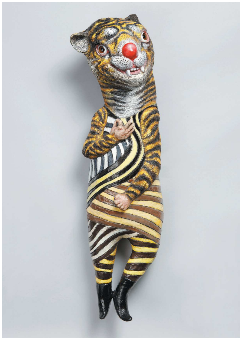
馬戲團版十二生肖 - 虎 The Chinese Zodiac: Circus Series: The Tiger 77×31×20 cm

這隻老虎沒有披著羊皮，披著的是老虎背心洋裝，她穿著高跟鞋，是隻母老虎。她歪斜著頭瞪著斗大的杏眼，左手握拳，右手在胸前比個「三」，尖牙外露。雖然是馬戲團裡的老虎，仍舊是隻兇猛的母老虎。