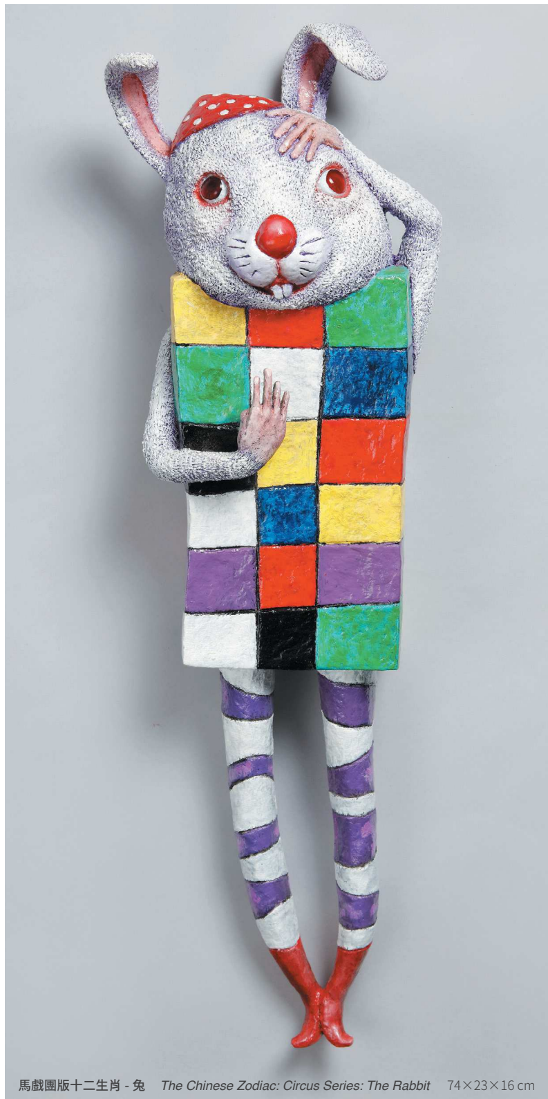
馬戲團版十二生肖 - 兔 The Chinese Zodiac: Circus Series: The Rabbit 74×23×16 cm

這隻馬似乎是嘻哈的舞者，他穿著深藍背心，穿著著拇指粗的金項鍊，下半身穿著深藍灰色相間條紋的緊身褲，配著馬靴，兩手穿戴似麥可·傑克森 (Michael Jackson) 的白手套。舞功高強的他，將左手擺在腰間，右手配合舞姿，帥氣地比了一個「七」。