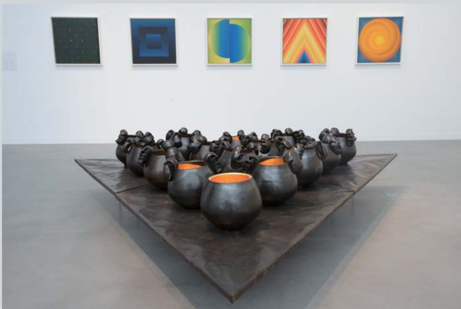
《太陽雨：1980年代至今的東南亞當代藝術》展場一隅