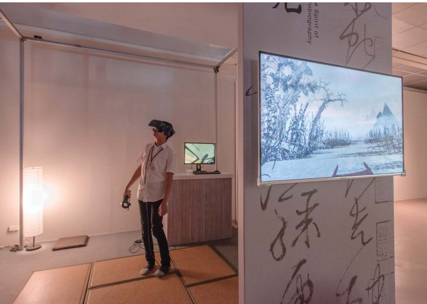
《國寶新境：故宮X高美館》展場一隅

2019年啟動會員招募制度，採分級制。6月專屬網頁與會員資訊管理系統正式上線，9月結合在地藝企合作資源於館內一樓大廳完成會員接待招募服務專區。依消費受眾及潛在客群屬性，企劃專屬之會員套裝方案，強化與高美館之黏著度，拓展自籌經費來源。此外，積極整合館內外資源與各項設施服務，與同為高雄市專業文化機構的高雄市電影館、高雄市立歷史博物館進行三館會員聯合企劃，並與駁二藝術特區等藝文機構締結年度共計12家合作夥伴館所，結合館內自營「高美書屋」複合式藝術商業空間推出會員專屬消費優惠方案以及館內各類活動優惠方案，年度並推出會員限定之藝術導覽、品味生活課程，以強化高美館藝術生活圈整體品牌形象。