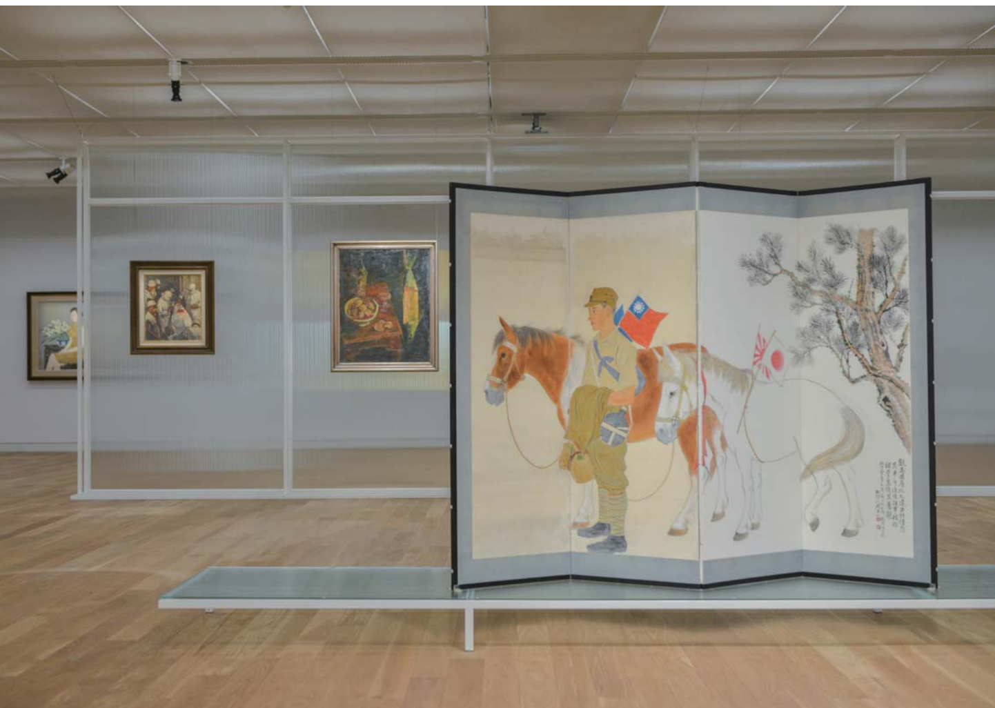
《南方作為相遇之所》展場一隅