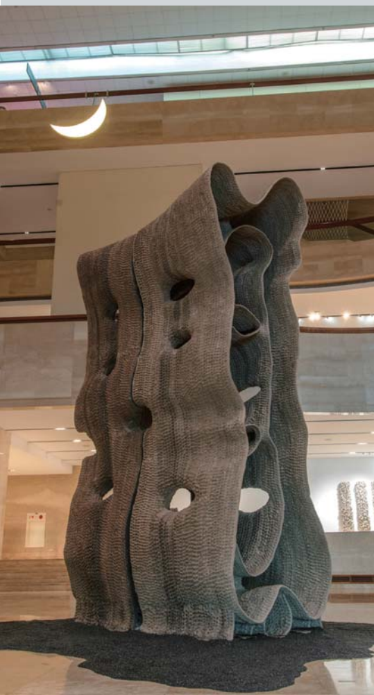
《以光織界：徐永旭的藝術世界》展出現場