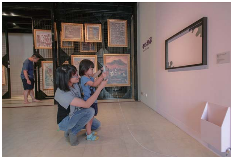
兒美館《藝術，在這裡》展場，內有許多 AR 互動科技，讓小朋友可以透過科技與展品互動