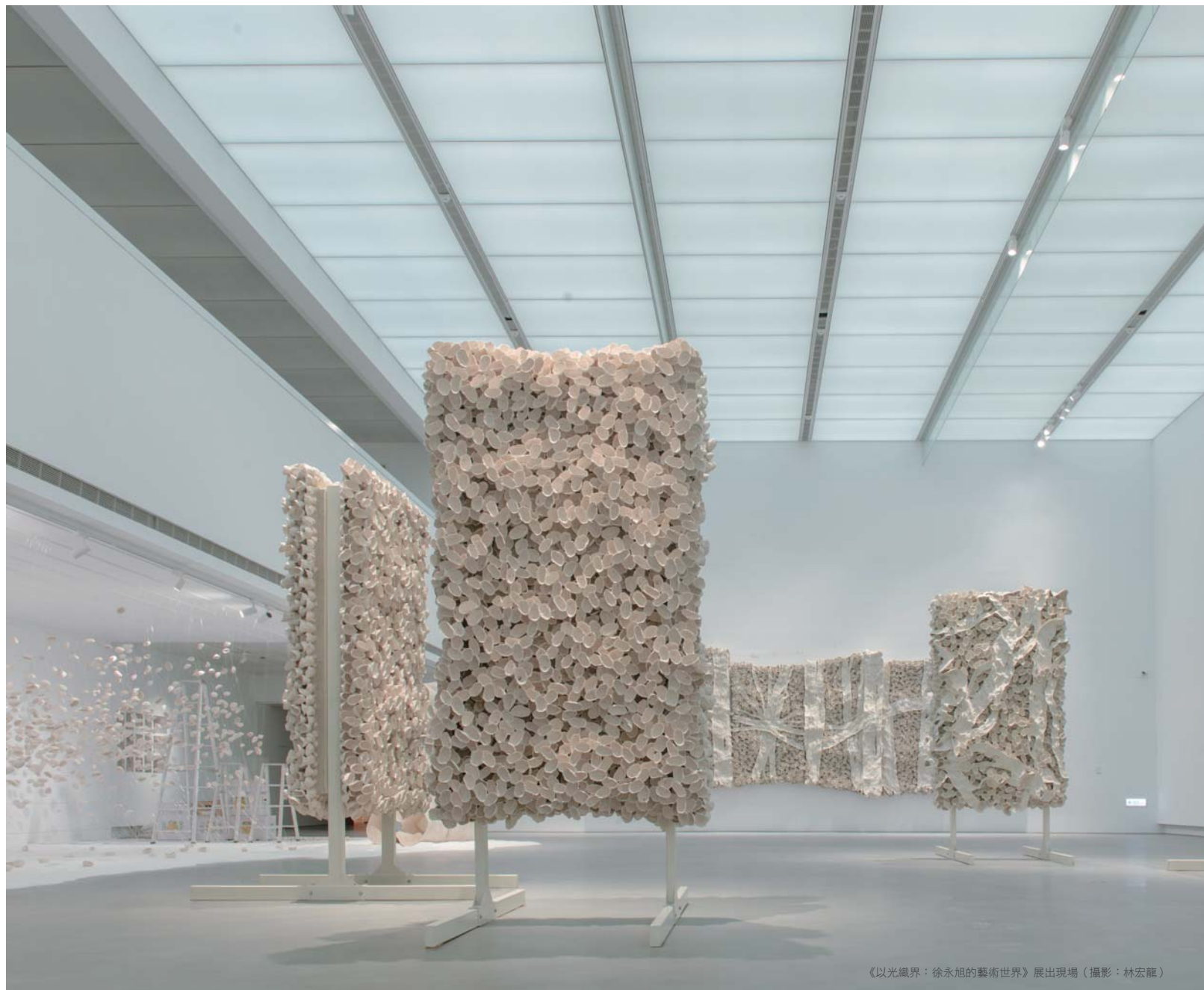
《以光織界：徐永旭的藝術世界》展出現場

2. 高齡觀眾藝術計畫：在邁向高齡化的社會趨勢與特殊需求，發揮社會責任，提供長者藝術手作服務課程，為大同醫院失智長者團（11位長者10位陪同者）提供版畫《幸福大紅包工坊》、高雄市家庭照顧者關懷協會（21位關懷對象10位陪同者）進行《植物槌染工坊》與高雄榮民總醫院心臟衰竭養心病友會（15位病友6位醫護）提供《植懂你心工坊》課程，更走入社區《捲紙藝術工坊》與中山大學、鹽埕老人活動中心合作（20位長者7位陪同者）。