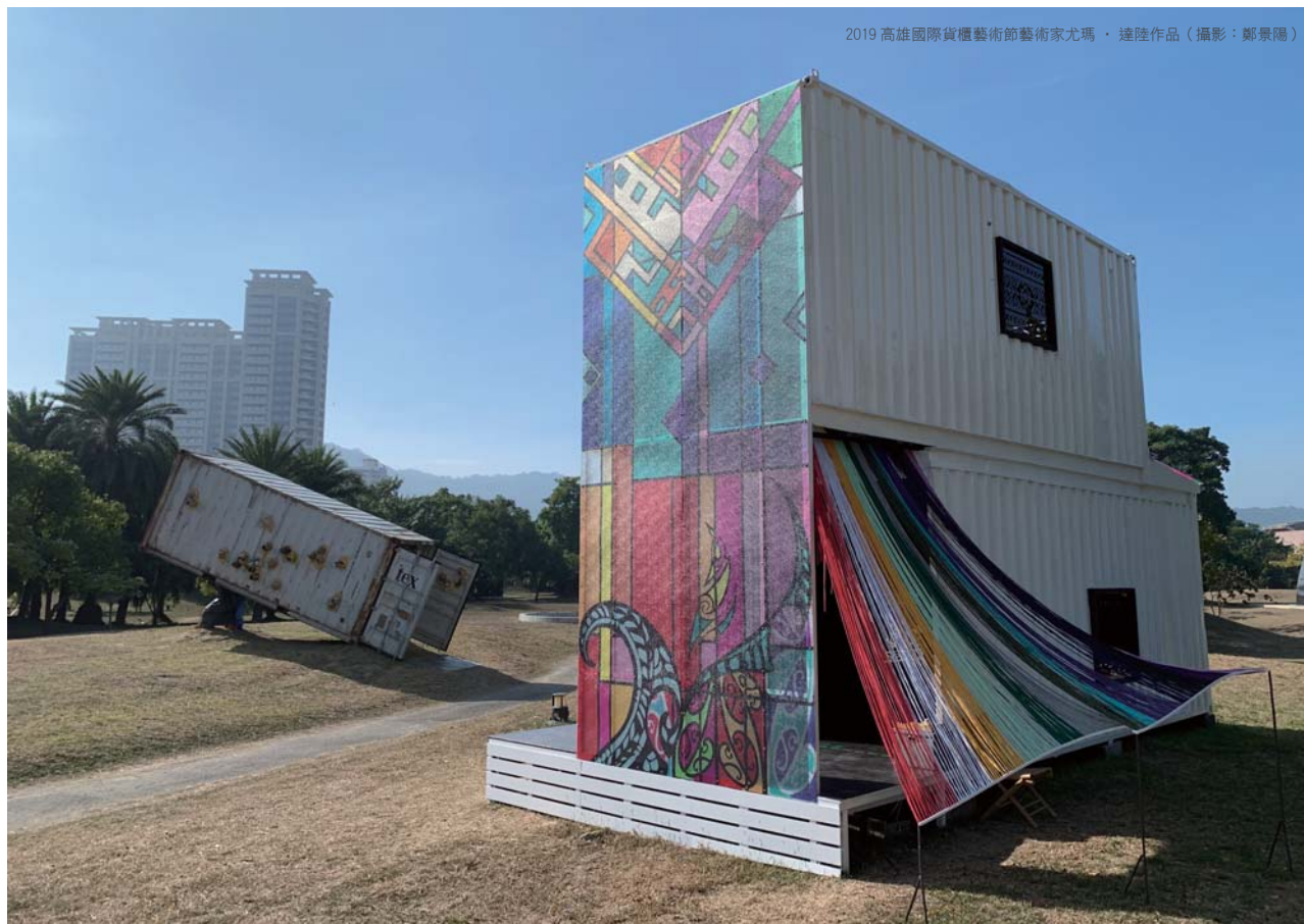
2019 高雄國際貨櫃藝術節藝術家尤瑪·達陸作品

本屆藝術節正逢第 10 屆辦理，規劃上與高美館經營 10 年有餘的南島當代藝術能量相互加乘，並將多年來一直在港邊發展的貨櫃藝術節拉回高美館園區。展覽以「陷阱」作為命題，輻射到生活、土地、社會、政治、經濟等面向，透過藝術表達對山林、海洋、原初生活型態的嘆詠與回應。本屆邀請第 20 屆國家文藝獎得主撒古流擔任藝術總監，參展貨櫃作品共計 12 組 13 位藝術家，包括尤瑪·達陸 / 泰雅族、魯碧·司瓦那 / 阿美族、巴豪嵐 / 吉嵐 / 排灣族、尼誕·達給伐歷 / 排灣族、達比烏蘭·古勒勒 / 排