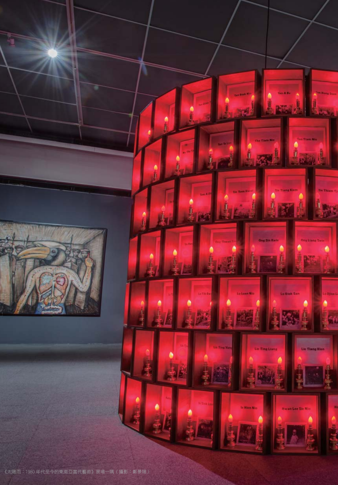
《太陽雨：1980 年代至今的東南亞當代藝術》展場一隅