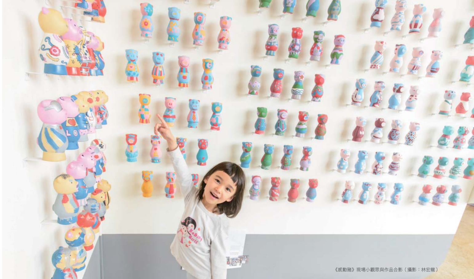
《感動豬》現場小觀眾與作品合影