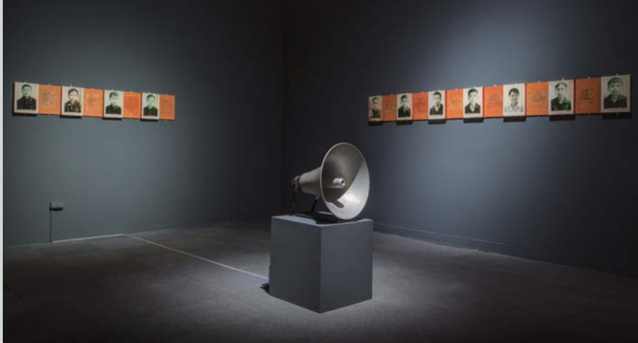
《太陽雨：1980 年代至今的東南亞當代藝術》展場一隅