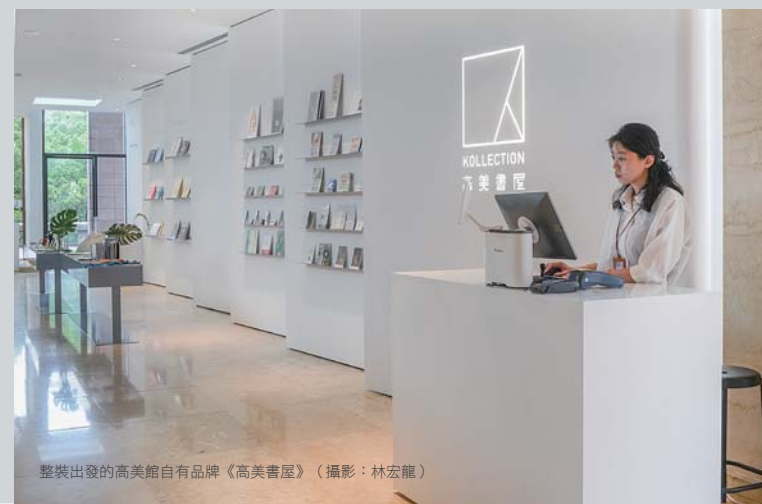
整裝出發的高美館自有品牌《高美書屋》