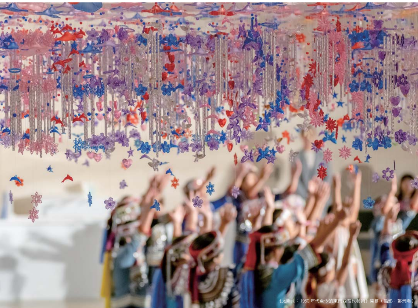
《太陽雨：1980 年代至今的東南亞當代藝術》開幕

4. 2019 年以「South Plus 大南方關鍵典藏計畫」及「新設典藏庫房空間處理及相關設備規劃設置」等案執行文化部「推動藝文專業場館升級計畫—地方美術館典藏空間升級或購藏計畫」補助，新設庫房方面將館內既有畸零空間整飭為 130 坪庫房空間 (11 月 7 日竣工)，設有掛畫網架 50 座及各式作品架 9 座。