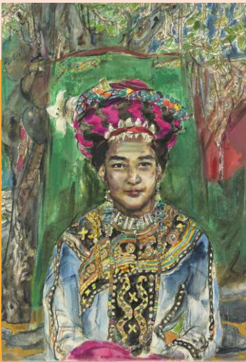
羅清雲 | 魯瑪拉拉特公主 水彩、紙 | 75x51.5cm | 1988

黃、黃橙、橙三個色輪上的左右鄰居，稱為 類似色 ；正對面的鄰居，黃色與紫色，紅色 與綠色，稱為 互補色 。正對面鄰居的左右鄰居，如紅色與綠色、黃綠色、藍綠色，則稱為 對比色 。